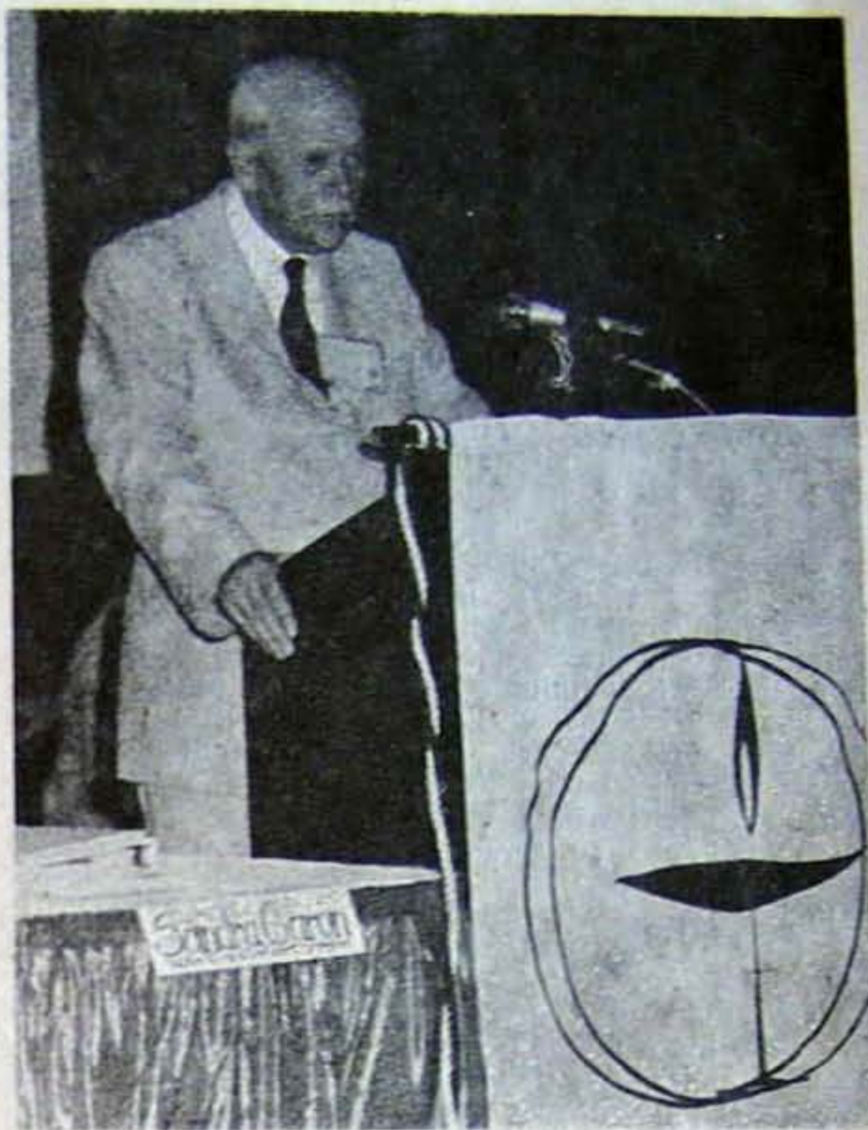
Az atlantai kongresszuson

Az elnöki beszámolót a moderátor asszony jelen-