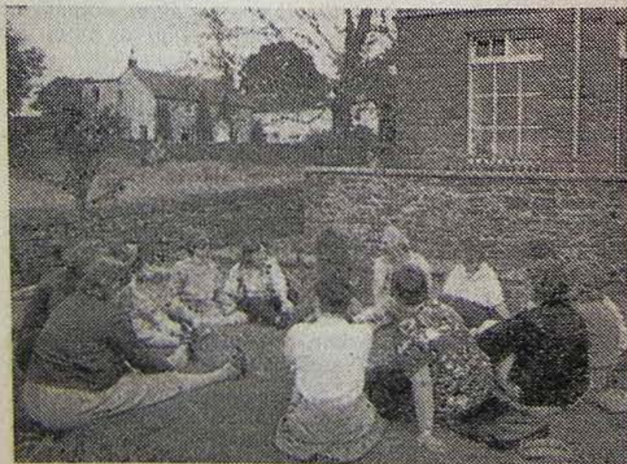
Az angliai Great Hucklow-i unitárius gyermeknyaraló kertjében beszélgetnek az ifjúsági konferencia résztvevői