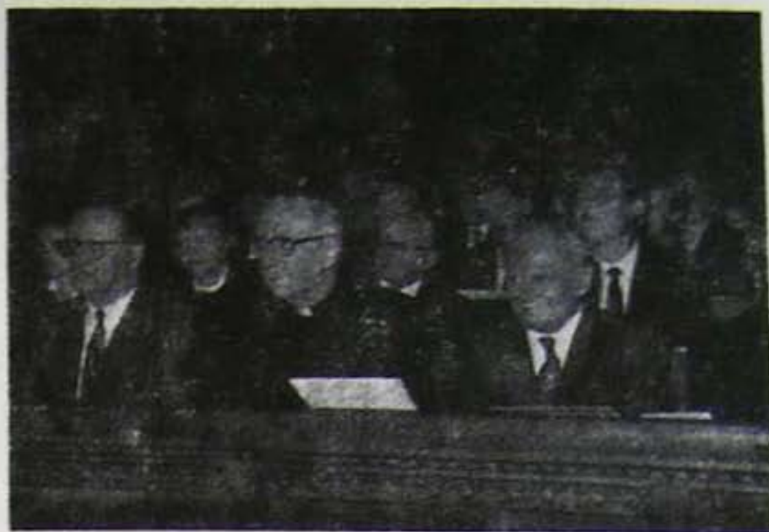
A szept. 22-i ünnepség díszvendégei: jobbról balra haladva: Göncz Árpád köztársasági elnök, Paskai László bíboros-érsek, Szabad György, az Országgyűlés elnöke.