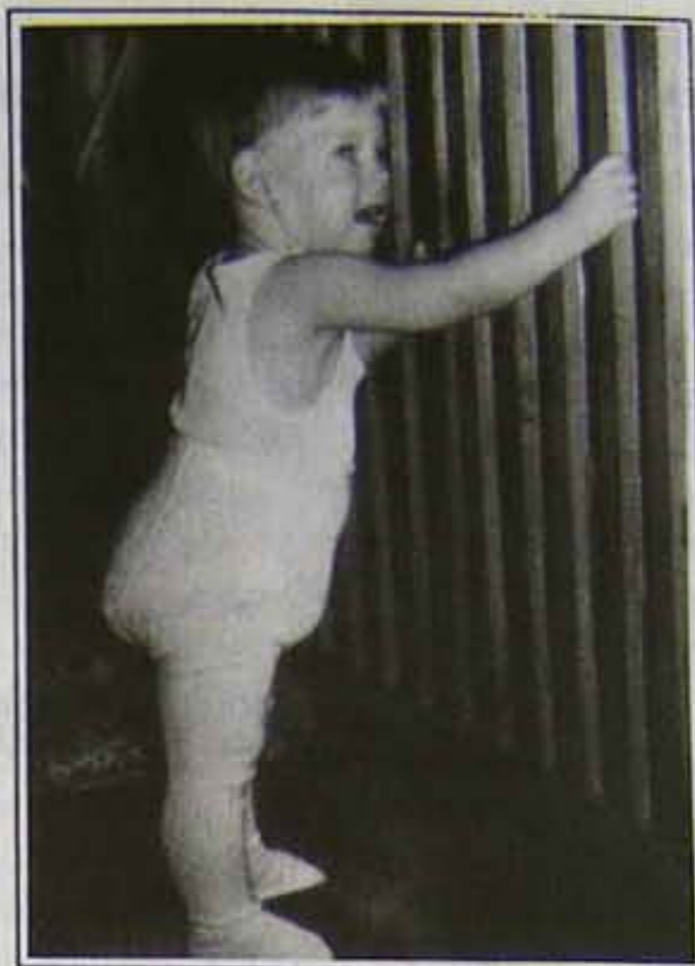
Sz. Z. 1 évvel később

mindig elzárkózott mindenféle publicitás elől.