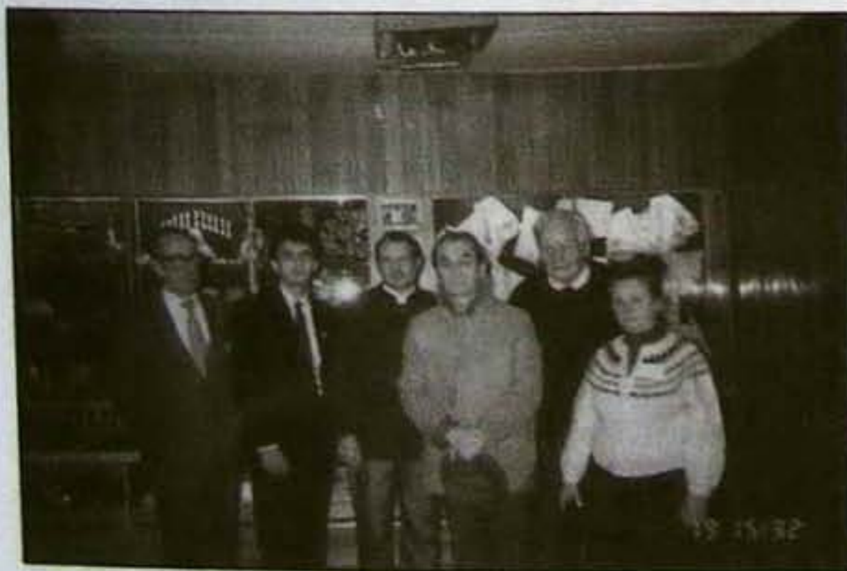
Az unitárius egyház delegációja a Naumann-alapítvány által rendezett visegrádi konferencián.