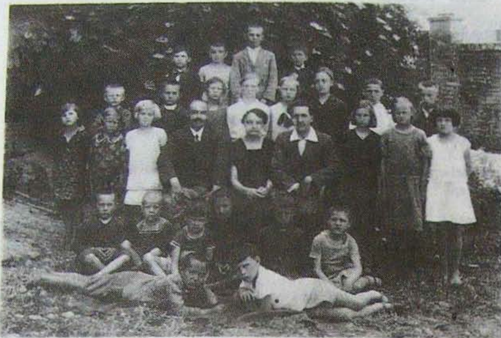
Hódmezővásárhely, Unitárius Elemi Iskola 1929–30. tanév