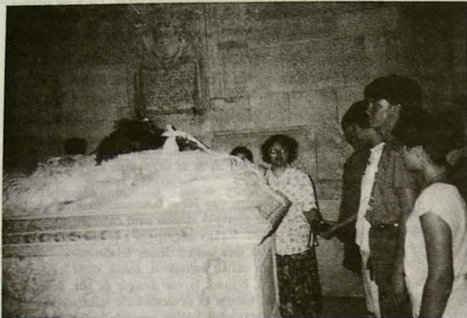
János Zsigmond szarkofágjának megkoszorúzása Gyulafehérváron