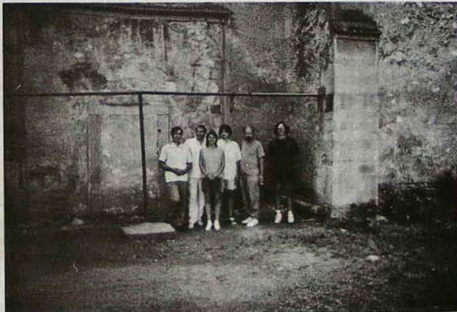
A beregi delegáció a tordai őtemplomnál Dombóra tartva.