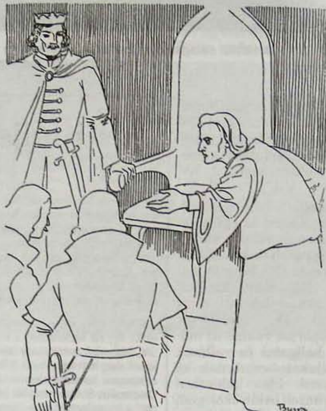
A Domine tanácsa

– Ez biztosan öfelsége házi kápolnája, – suttogta Alojzusz a többinek.