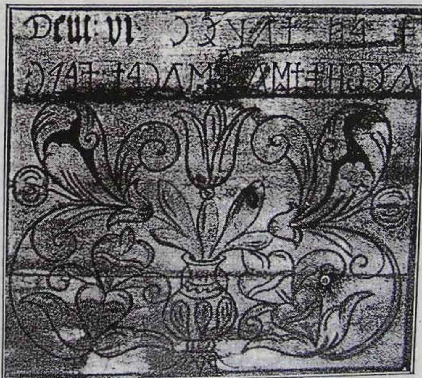
Az énlaki templom mennyezetének híres rovásírásos felirata. „Egy az Isten Deut: VI. Georgius Musnai Dakó.” (L. Ferenczi Sándor: Az énlaki rovásírásos felirat [Kvár. 1936.] c. könyvét.)