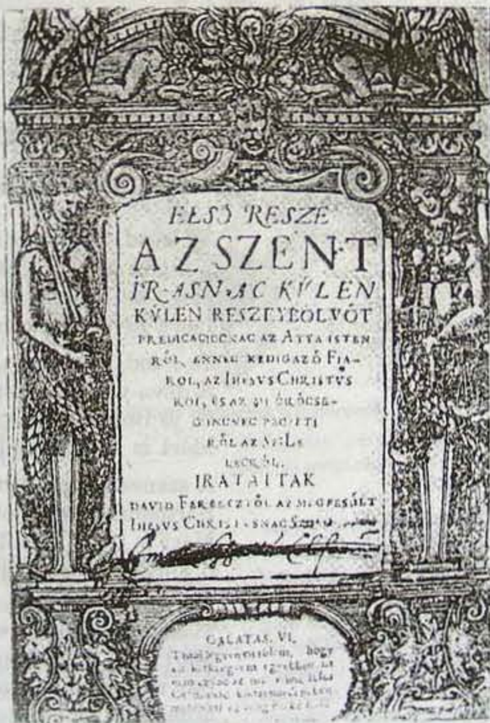
DÁVID FERENC MAGYAR NYELVŰ PRÉDIKÁCIÓS KÖTETÉNEK CÍMLAPJA, 1569 (A könyv a Magyarországi Unitárius Egyház tulajdona)

– Még a későbbi nagy ellenfél, Méliusz is meghökkent és megtorpant a nagy igazsággal szemben ... de csakhamar visszarettent tőle, és egy közösen szerkesztett hitvallás után visszacsatlakozott a pápások „igazságához”, a régi tradíciókhoz. Szívemnek egyáltalán nem örvendetes vitatkozás sorozatra kényszerített. Ó hogy gyűlöltem ezeket a perlekedéseket Isten ügyében!!! Hogyan keveredett bele mind több személyes gyűlölet, irigység, vagy bosszú az ellentétbe. Csak a fejedelem és néhány főúr maradt az igaz út mellett ... és a nép... –