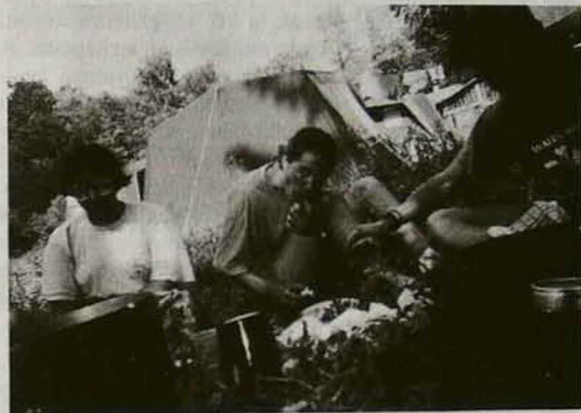
A tábor „vezérkara” ebédel

Igen, igen! Így lesz. Bizonyosak lehettek benne!