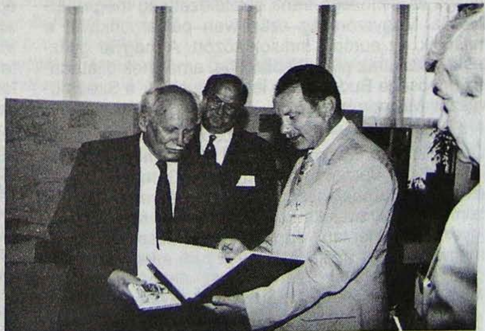
Göncz Árpád köztársasági elnök emléksorokat ír a beregi szórvány emlékkönyvébe.