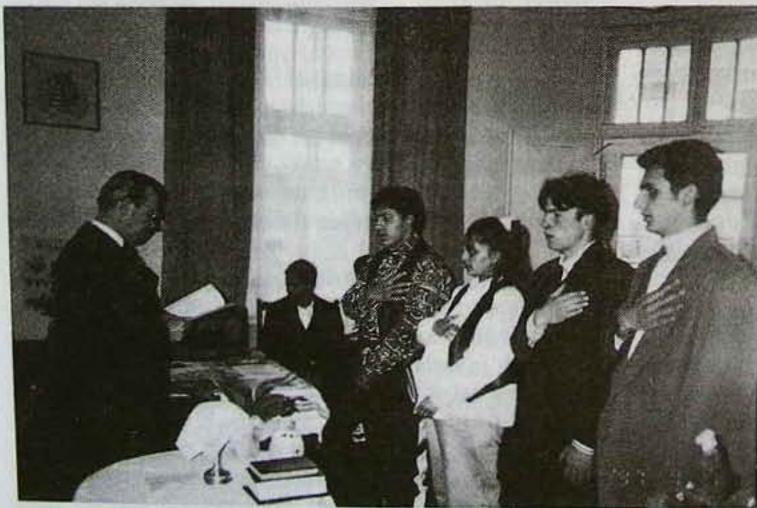
Fiatalkónusjelöltek fogadalomtételé Vásárosnaményben a beregi unitárius szórvány gyülekezeti termében.

A városiasodás egyik nagy hátránya az elidegenítő lakótömbökbe szorulás, illetve a cigány gettók kialakulása. Ebben az esetben a lakónegyedi apostolok, „osztályfőnökök” kiépítése, szolgálata a legjobban bevált módszer. Fontos a család-pasztorizáció, hisz ennek révén jut felszínre, hol, kiket, miben kell segíteni. Az elmagányosodás, egyedül lét feloldására közösségi rendezvények, kirándulások, egymás meglátogatása, házi istentiszteletek szervezése, speciá-