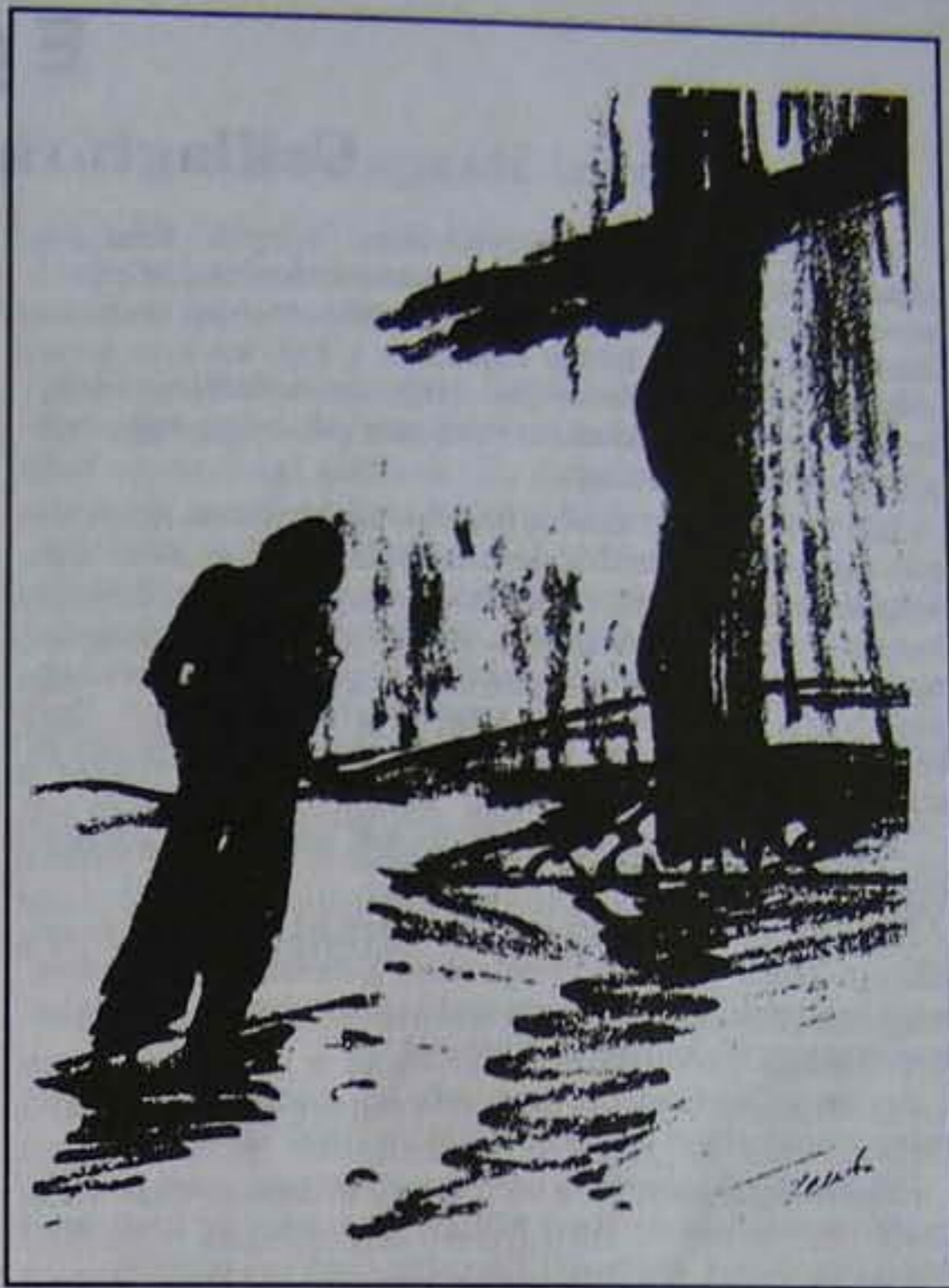
Török Levente illusztrációja Oláh András Cantata profana című költeményéhez.

tizenkét Júdás készül az árulásra – arcukon egyforma mosoly – nyirkos kezüket nyújtják s lassan keresztté növekednek a fák