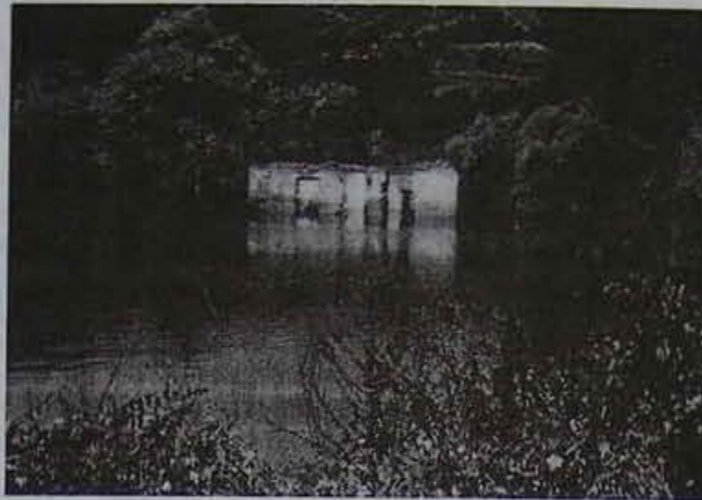
„Atlantisz harangoz” I., 1993

nagy nehézségeket és megpróbáltatást jelentett, az az első világháború volt és az azt követő változások okozta terhek. A világháború első évében elviszik az egyházközség nagyobbik harangját, minden ellenszolgáltatás nélkül. Csak a háború után sikerül vásárolni egy egészen kisméretű harangot. A lelkészi lakást is megviselte az, hogy 1912-