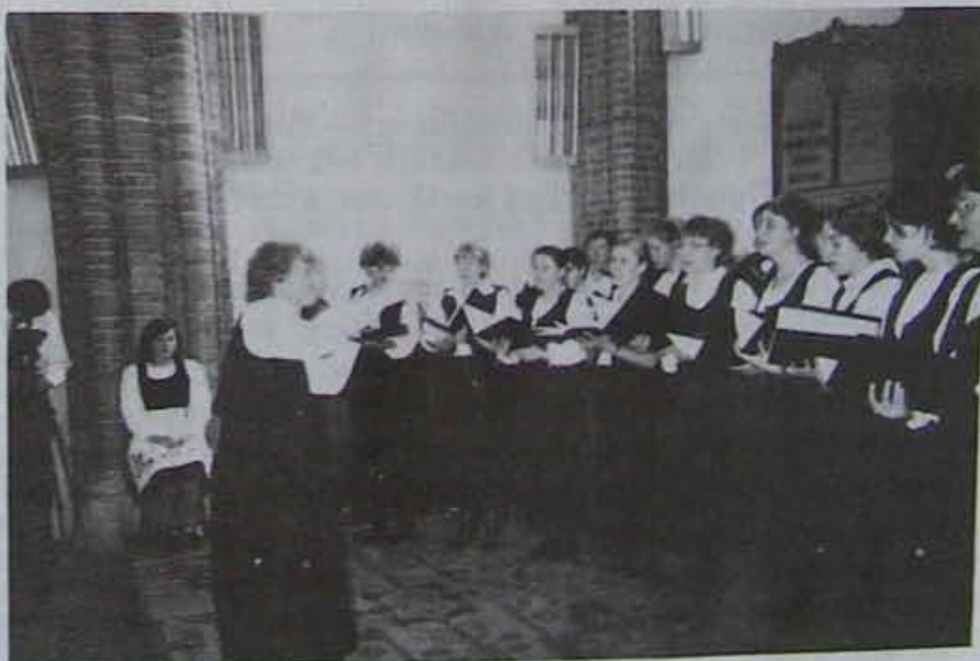
Az Országos Széchényi Könyvtár Énekkara a Brassai-ünnepségen