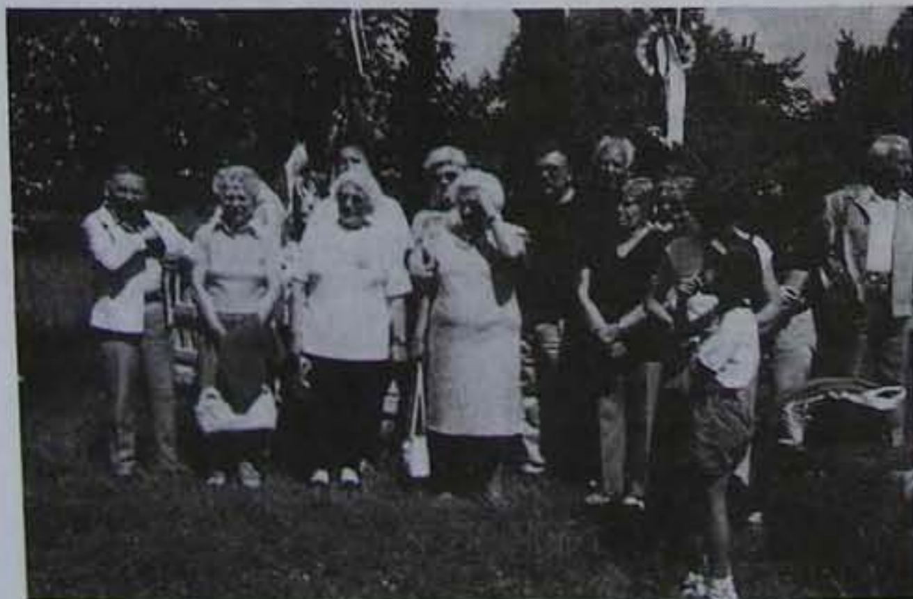
A túra résztvevői

A következő két napon a fürdés kedvtelésének is hódolhattunk igazán változatos időjárási viszonyok között.