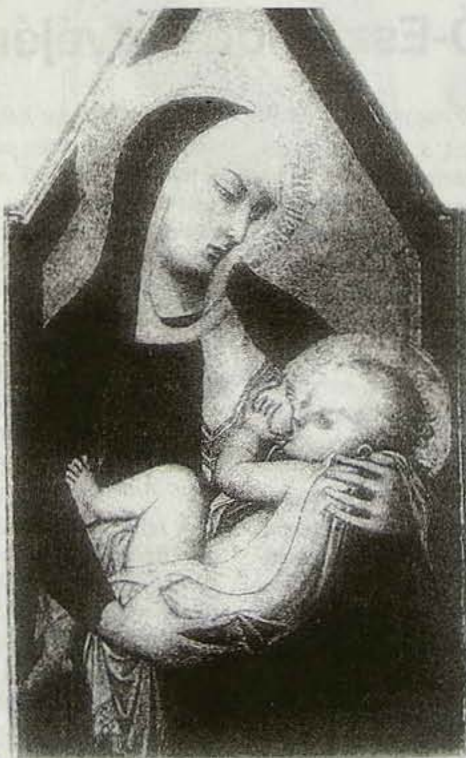
Ambrogio Lorenzetti: Madonna a gyermekkel

mai legendák fogalmaival. De nem is a mai kor szavait kell keresnünk egy ókori legendában. Nem kérhetjük számon a centiméter-gramm-szekundum (CGS) rendszert az egyszerű palesztinai embereken.