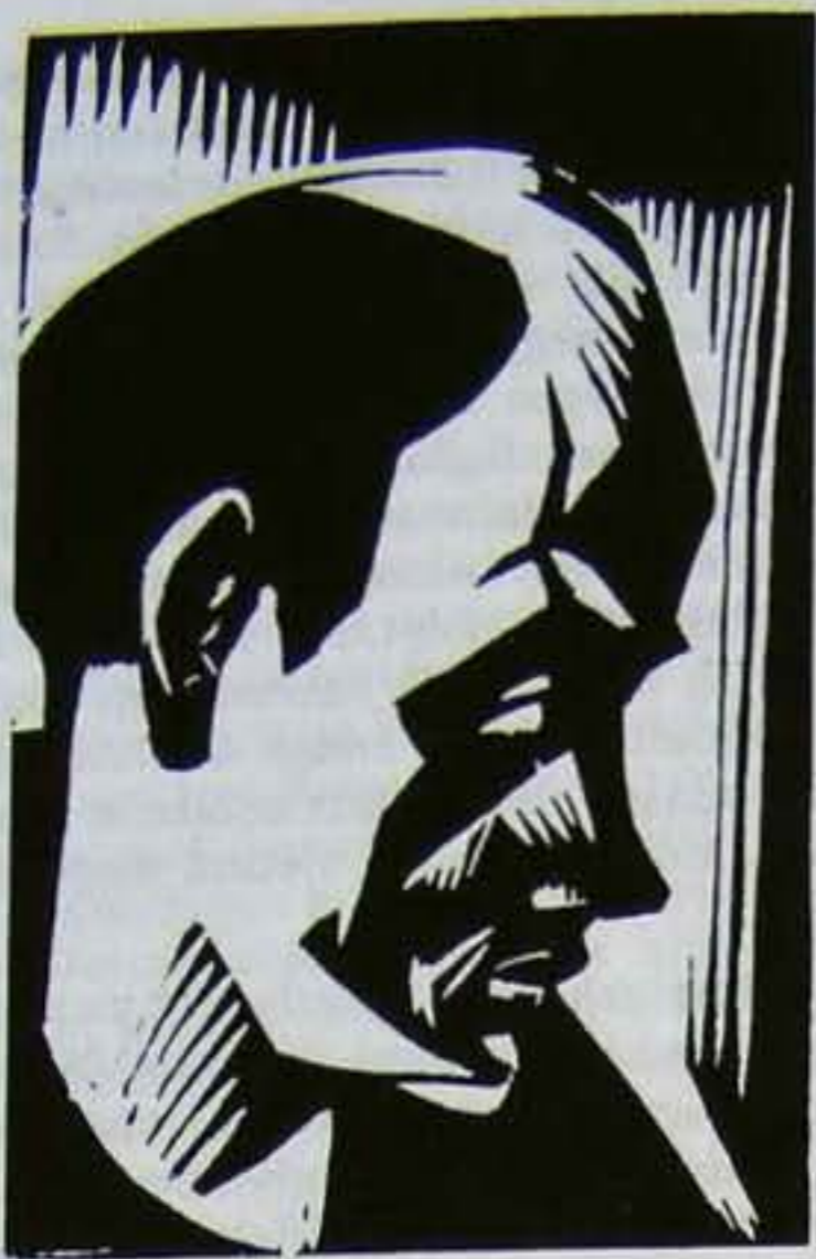
„A székely írófejedelem” – Nagy Imre fametszete, 1930