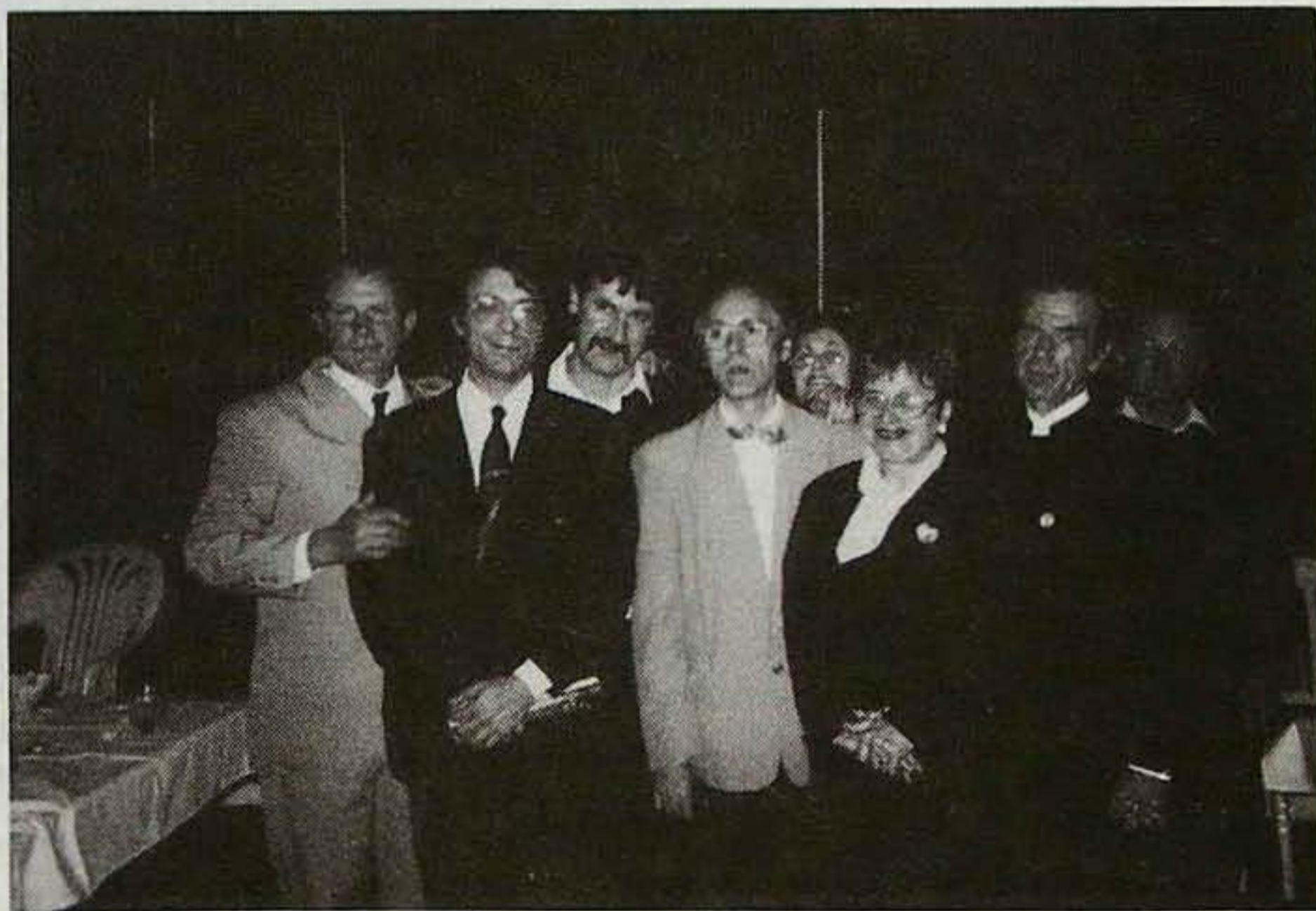
A Szabadelvű Protestáns Kör vezetősége a mátészalkai reformációi emlékünnepeken.

A beregi unitárius szórvány cigány etnikumú csoportjában 1996. második felében 5 keresztelő, 5 esküvő és 15 felnőtt áttérése volt.