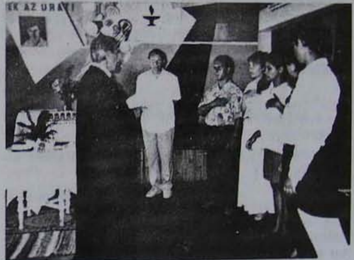
Cigány konfirmálók Vásárosnaményban 1997 pünkösdjén.