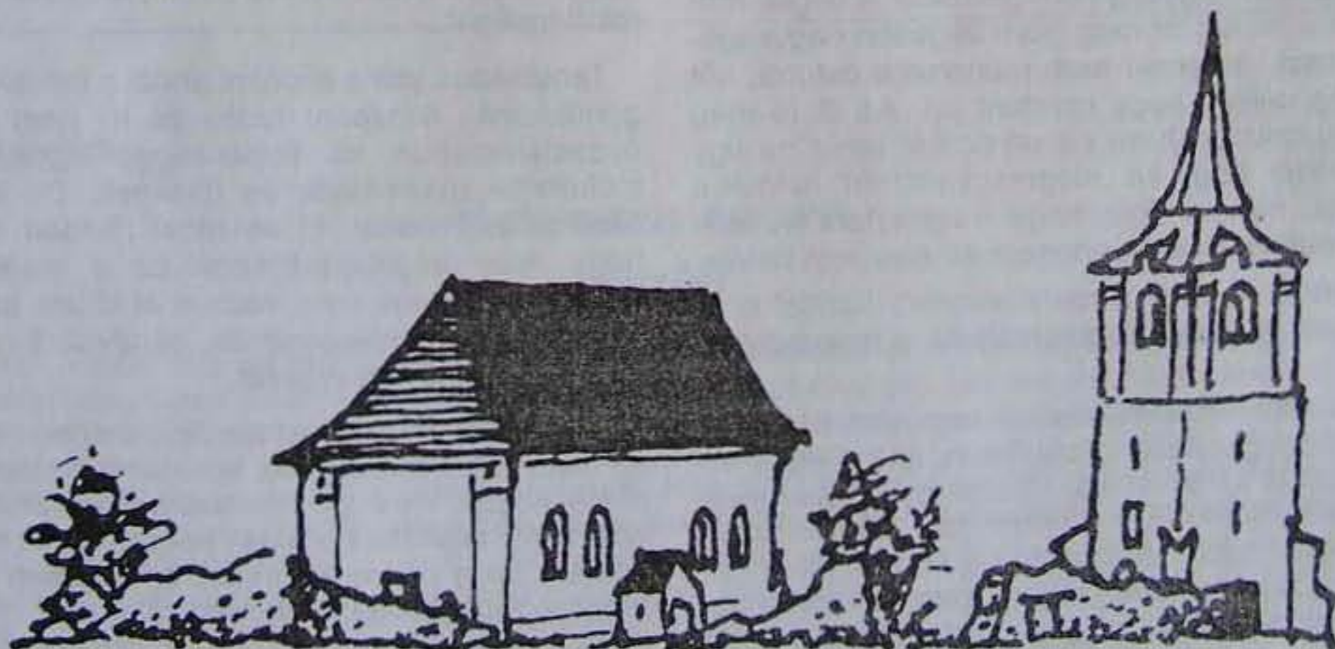
A homoródszentmártoni templom napjainkban.