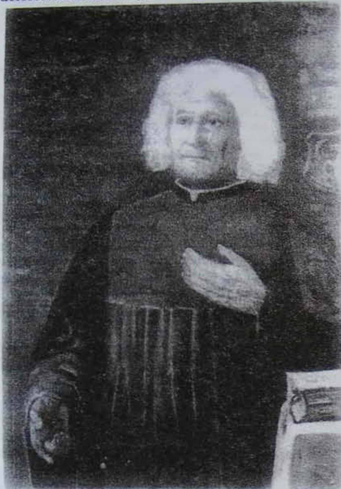
Szinte Gábor: „DÁVID FERENC”

Írásain kívül kevés adat maradt a vallásalapító Dávid Ferencről. A XVI. században a városi polgárság számára tekintélyük érdekében kívánatos volt arckép készítése. Erdély az elmaradottabb régiókhoz tartozott. Szenczi Molnárról is csak fiatal korában Németországban készült rajz. Valószínűleg Dávid Ferenc puritán egyénisége is akadály volt annak, hogy nem készült arcáról egy vándorfestő ezüstceruzája alól egy arcképvázlat sem.