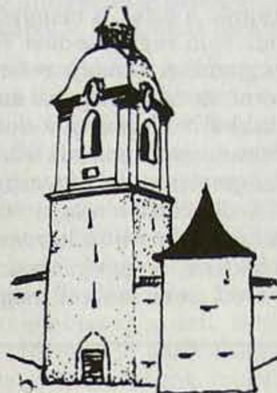
A székelyderzsi templomerőd kaputornya régen és napjainkban: a – 1606-tól 1868-ig; b – 1868-tól