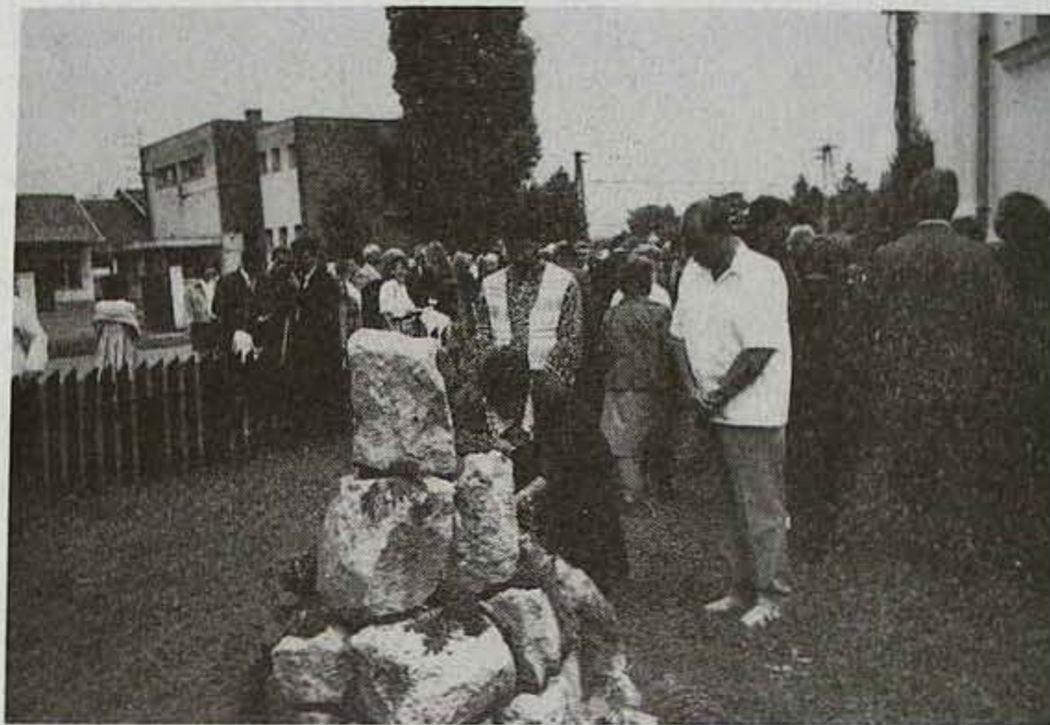
A beregi unitárius delegáció koszorúzása a füzesgyarmati millicentenáriumi emlékműnél.

A templomkertben lévő millicentenáriumi emlékmű felavatása a 199. zsoltár elénekelésével kezdődött. Az avatóbeszédet dr. Murvay Sámuel főgondnok mondta. Beszédében megemlékezett az Unitárius Egyház megalakulásáról, de beszélt a történelem folyamán