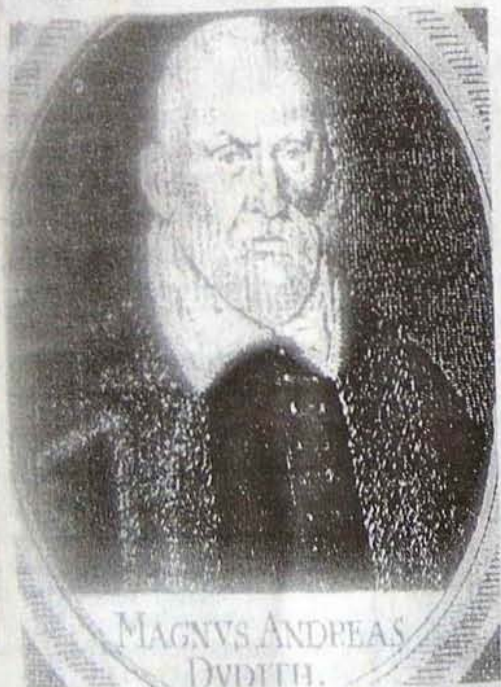
Dudith András (1533–1589)