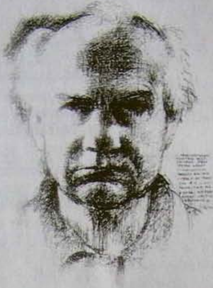
László Gyula: Önarckép