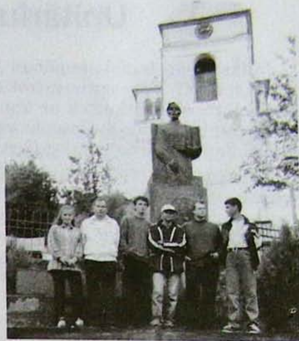
Az unitárius ifjúság delegációja a bölöni Erdélyi Unitárius Konferencián

Vasárnap délelőtt záró istentisztelettel búcsúztunk a tábortól. Eső közepette összehajoltunk sátrainkat, és elbúcsúztunk egymástól, mindenki felszállt a megfelelő vonatra, és megkezdődtek az átlagos hétköznapiak. A konferencia leírása egész szórakoztatónak tűnik, de ez nem igaz. Első nap az embernek az a dolga, hogy a régi barátokat megkeresse, most is eljöttek-e. Elmeséljük egymásnak mi történt velünk, az eltelt egy év alatt. Első este együtt énekelünk a sátrak között. Együtt nézzük a hullócsillagokat. A két bal lábunkkal próbáljuk eltanulni a tánc lépéseket, a tánc házban ne-