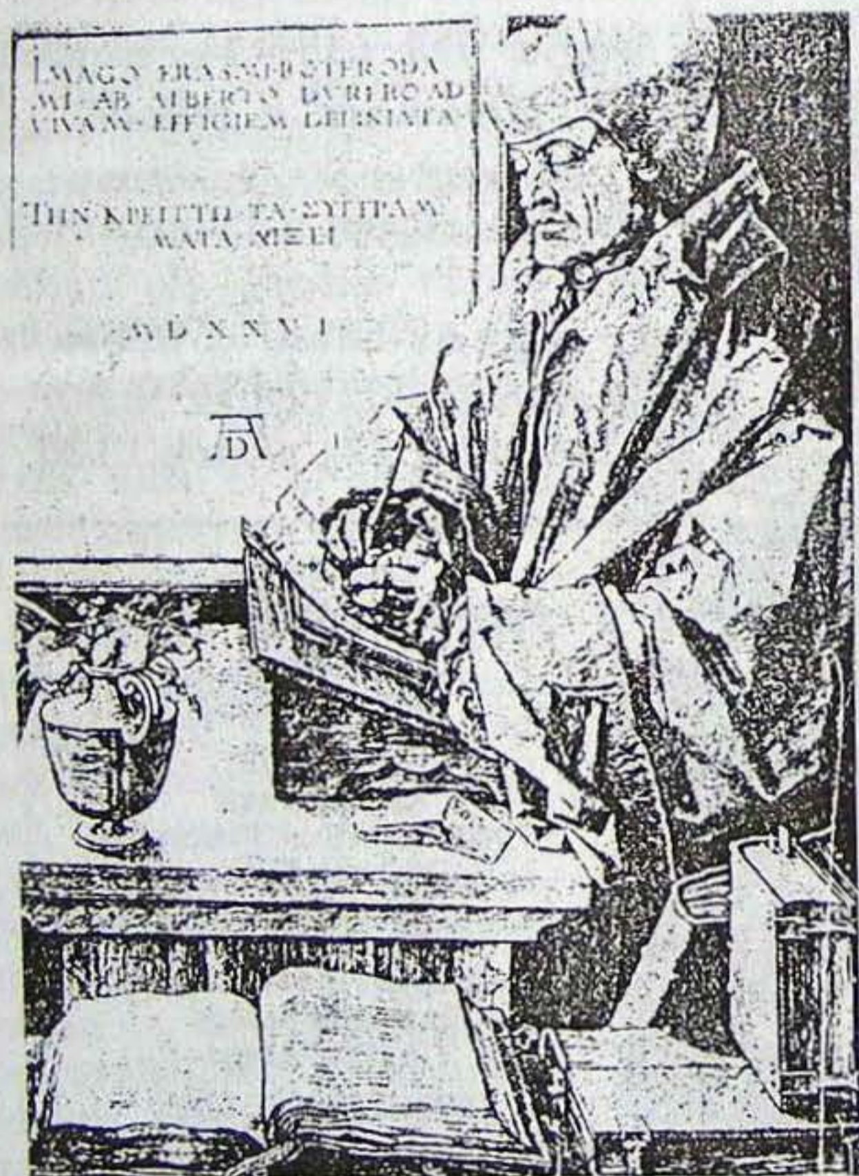
Rotterdami Erasmus (1469–1536)