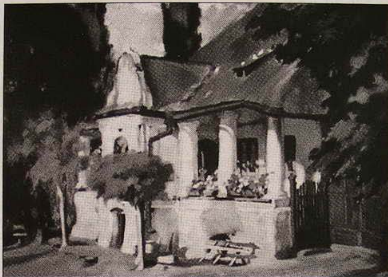
A magyarsárosi kúria