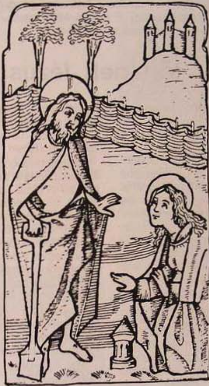
„Noli me tangere!”

Jézus tanult voltának egyik bizonyítéka az, hogy mesteri módon élt a példabeszédek adta lehetőség-gel mondanivalójának kifejtésében. A példázatok mű-