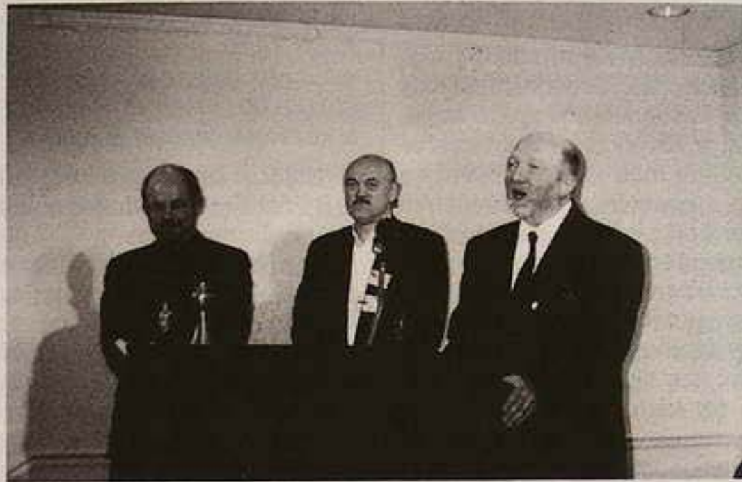
Közös prédikáció a Rockville-i templomban.

tos, nagyszerű és tökéletes világot. A teremben volt egy földgömb, amelyet amerikai asztronauták felvétele alapján készítettek el, akik az Élet bolygóját a Hold távolságából vették lencsevégre. Gyönyörű felvétel mindannyiunk otthonáról. Szép, színes és gazdag világot tár elénk. A baj ott van, hogy amit az isten nem tett meg, azt az ember elkövette, vagyis megosztotta a világot északi és déli, keleti és nyugati részekre. És míg Északra és Nyugatra került a jólét, a kiegyensúlyozottság, a kultúra és a civilizáció, addig Délre és Keletre mindenek az ellentéte. De alig hihető, hogy akik élvezik ennek a megosztásnak az előnyeit, szeretnének fordított helyzetben élni, és egy mozdulattal a földgömböt az addig ismert helyzetéből megfordítottam, így ami Északon volt az Délre került, amit addig a világ Nyugati részén tudtunk, az a Keletre költözött át. És ekkor mindenki számára világos volt, hogy talán egyetlen észak-amerikai sincs, aki Dél-Amerikába szeretne lecsúszni, és egyetlen skandináv sincs, aki Afrikában szeretné magát találni élete hátralévő részében. És ugyanez a helyzet vonatkozik a világ keleti és nyugati részére, ezért mindannyiunk konkrét feladata a jövőre nézve az, hogy a két világot egymáshoz közelebb hozzuk megértésben, jólétben, kultúrában, civilizációban egyaránt.