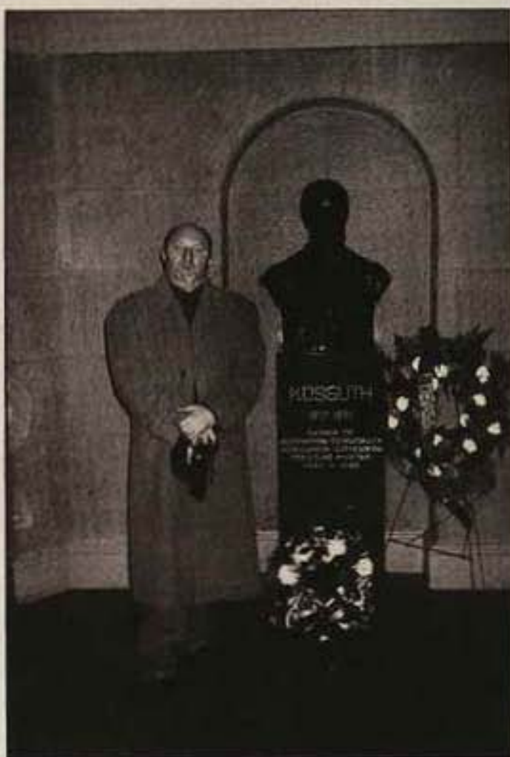
A Kossuth-szobornál, Capitolium, Washington D. C.

Az egész napi munkán és beszélgetéseken igyekezett enyhíteni az estére szervezett közös kulturális program, amely abból állt, hogy történeteket meséltünk el egymásnak a világ különböző részéről, majd az ének és zene próbálta közelebb hozni egymáshoz a gondolkodás és kultúra közötti távolságot.