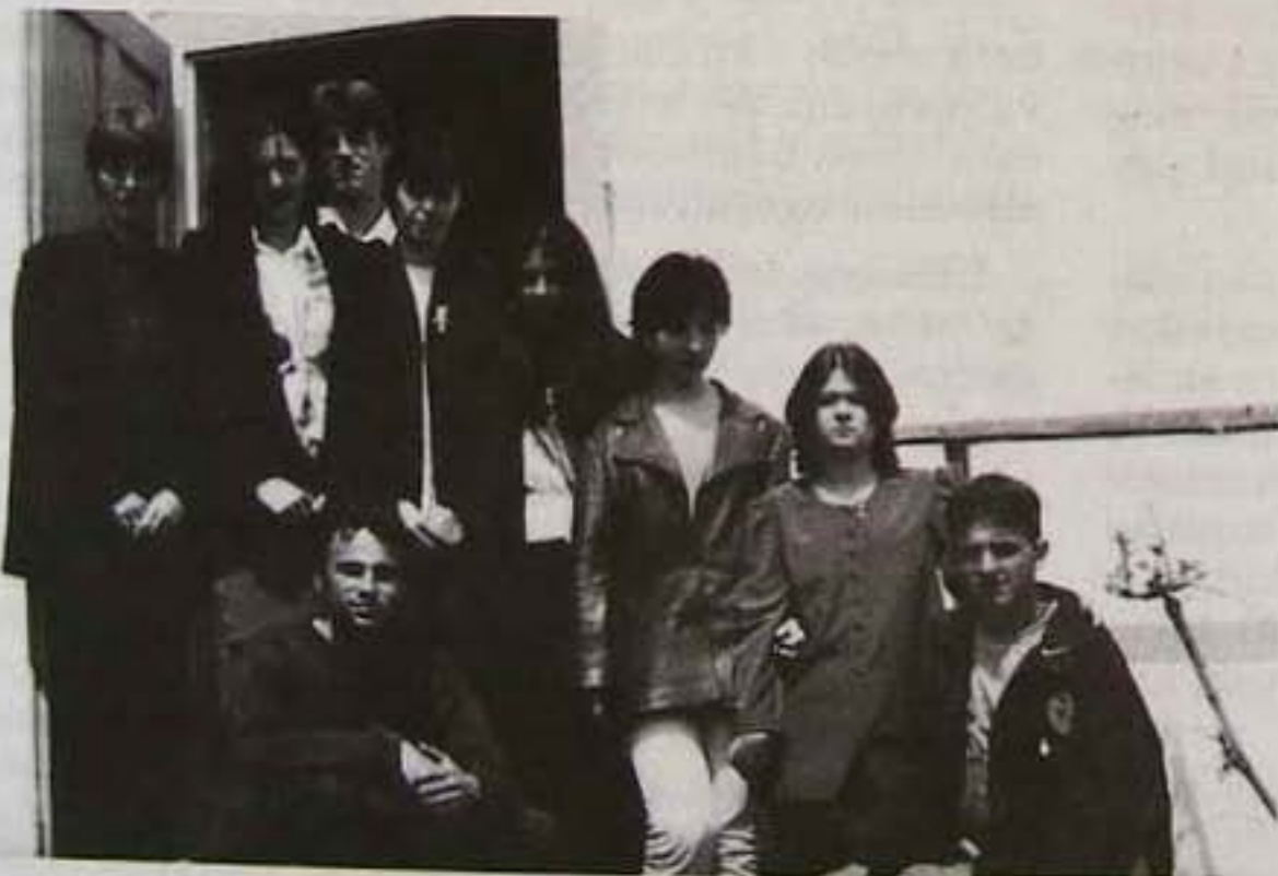
Az úrmösi Dávid Ferenc Ifjúsági Egylet anyák napi találkozója a BUNIK (Beregi Unitárius Ifjúsági Kör) vezetőségével.

A beregi unitárius szórvány életében a pünkösöd szimbolikus jelentőséggel bír. Létrejött és elindulása pünkösöd szellemében zajlott. Mit tanultunk elődeinktől? Isten azért teremtette az embert, mert a lét örömét meg akarta osztani velünk. Ezért optimistán kell szemlélünk a világot. A BUNIK (Beregi Unitárius Ifjúsági Kör) vezetősége is célul tűzte ki, hogy a tudás és a megtartó hit legyen a meghatározó erő tevékenységükben. Tudjuk, hogy Isten általunk is üzen, és mindnyájunkat örömeire hív Jézus által. Keresztényi felelősségünk abban áll, hogy eldöntsük, mit választunk: az istentörvényű léteket, vagy az öntörvényű egoizmust.