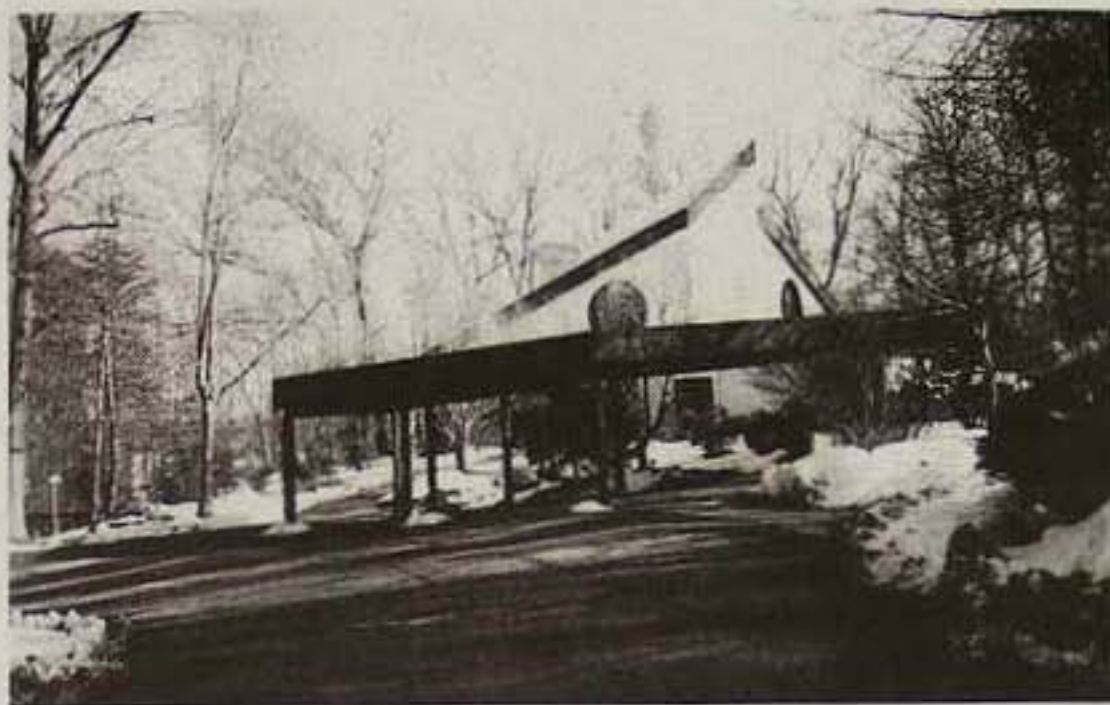
Unitárius templom Sanctuaryban.

Ez az anyag az ötnapi együttlét alkalmából még 100 oldallal bővült, hiszen ehhez adtuk hozzá otthonról hozott tájékoztatókat, beszámolókat, kéréseket, javaslatokat. Estére mindenki kijelölhette azon egyházközségeket Amerika, Kanada, Erdély és Magyarország térképein, melyeknek testvér-egyházközsége van a négy ország valamelyikében.