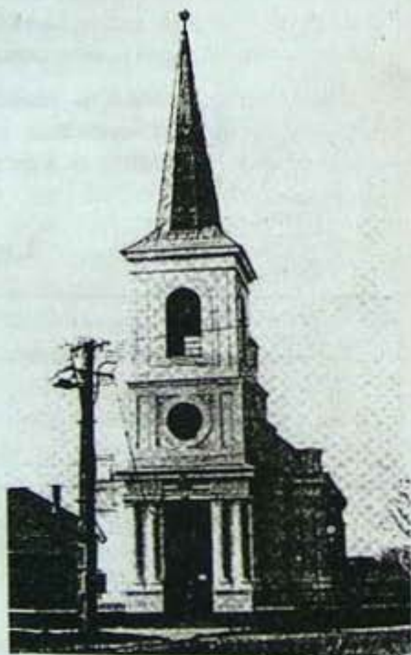
A füzesgyarmati templom 1903-ban