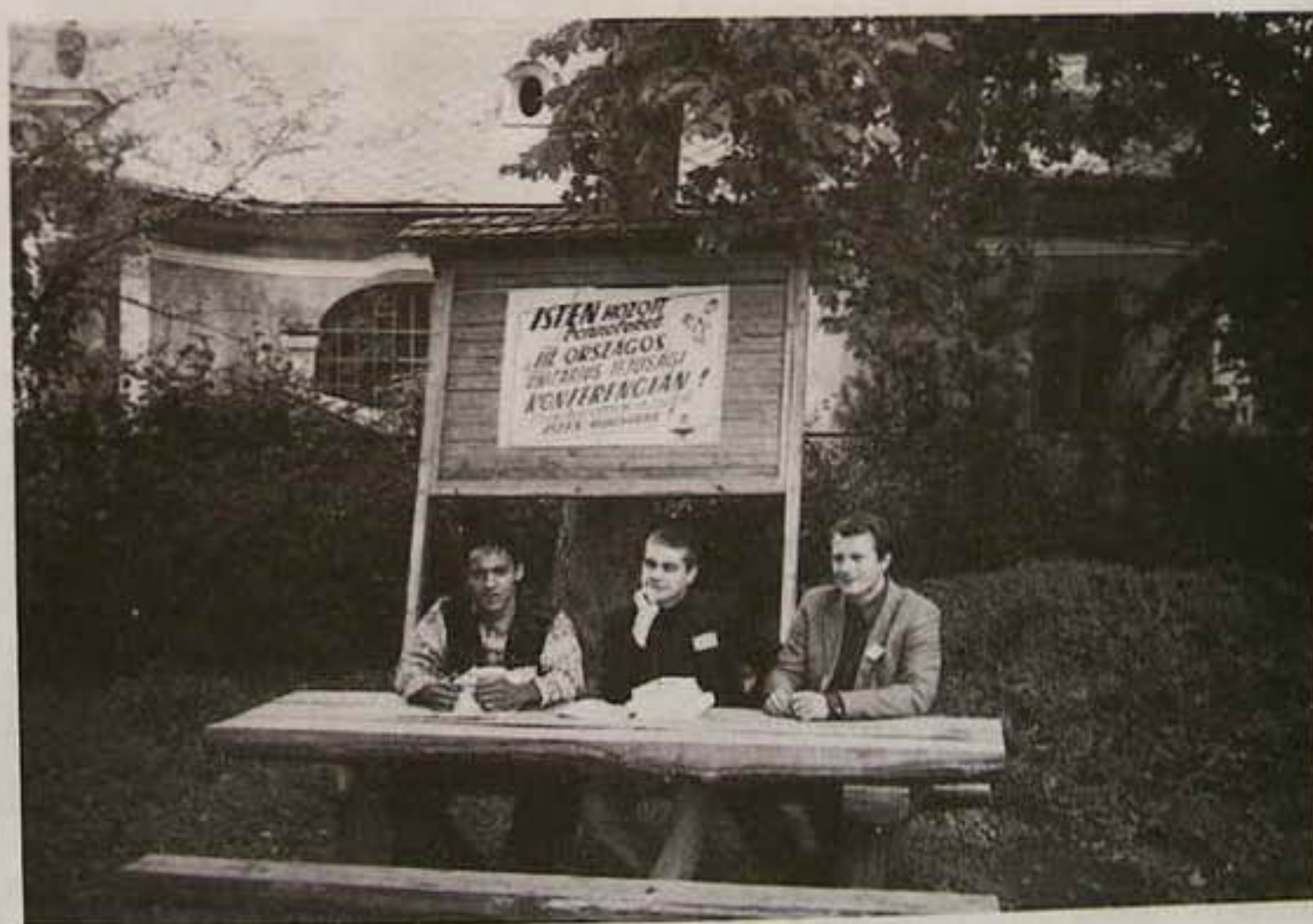
A III. Országos Unitárius Ifjúsági Találkozón Vásárosnaményban a BUNIK vezetősége