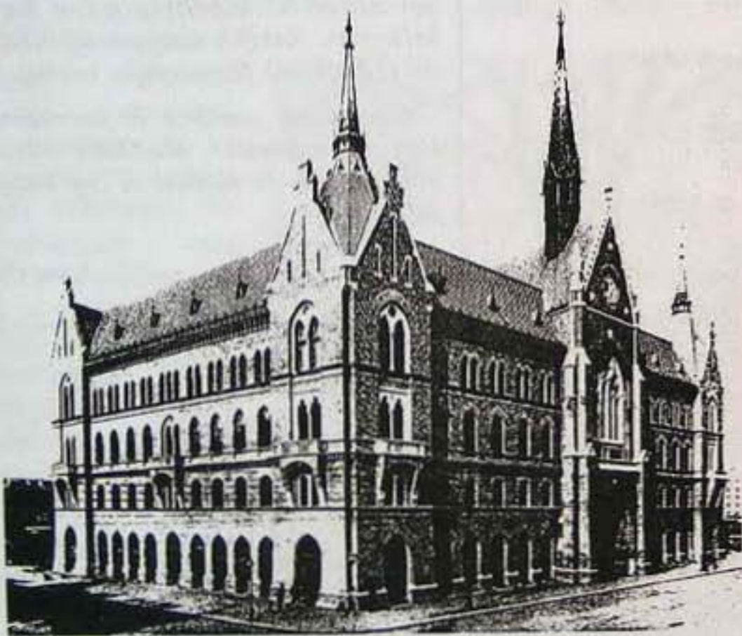
A Nagy Ignác utcai templom 1903-ban