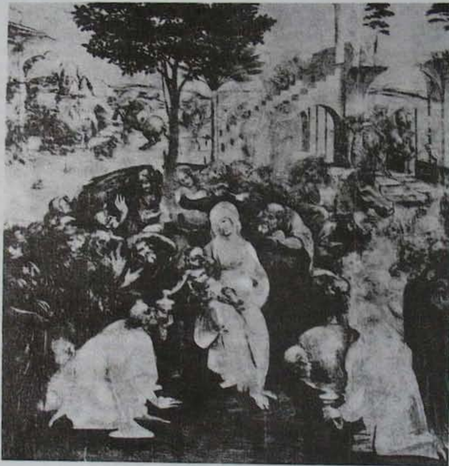
Leonardo da Vinci: Háromkirályok

Rongyba, pólyába s egy istálló-lámpa Sugárkörébe. Bús állati pára Lebeg körötte: a föld gőz-köre. A dicsfény e bús köddel küszködik. Angyal-ének, csillagfény, pásztorok S induló végtelen karácsonyok, Vad világban végtelen örömök Lobognak, zengnek – mégis köd a köd. S mindez olyan nyomorúan emberi S még az angyalok Jóakarata, Még az is emberi és mostoha.