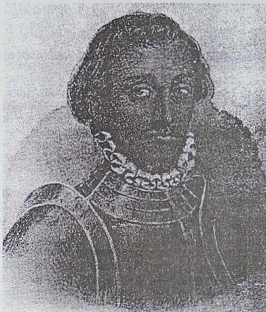
János Zsigmond (1540–1571)

A hagyomány szerint az unitárius János Zsigmond ot és az unitárius vallást ültették a vádlottak padjára