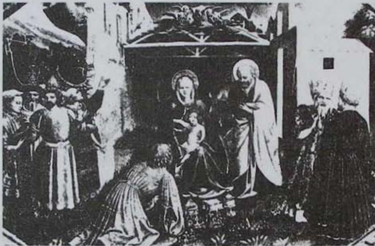
Fra Angelico: Királyok imádása (részlet)