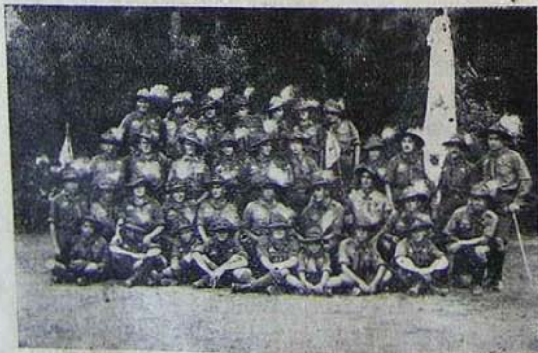
A 345. János Zsigmond cserkészcsapat a Jamboreen.

Néhány héttel ezelőtt még magyarázni kellett ennek az idegen szónak az értelmét s ma már ismerjük a jelentőségét annak a nagyszerű két hétnek, amit a világ cserkészfiái augusztus 1-15-ig Gödöllőn töltöttek. Mennyit álmodtunk róla s mennyi álmot szőttünk hozzá. Mennyit dolgoztunk érte. Mennyit vártunk tőle! És alig, hogy megérkezett ebben a gyűlölködő, gondterhes világban mint egy gyönyörű álmot, máris elszállt, mint egy álmot. Soha még két hét ilyen rövid nem volt a mi életünkben, de szépségével felülmulat a régi békevilág legszebb esztendőit. Összesűrösödött benne a világtörténelem, megépült és értelmet nyert Bábel. Két hétre örömköncseppé olvadtak a jeges óceánok, leomlottak a vámhatárok s három négyzet kilométerre miniatürözödött az öt világrész. Nem kellett utlevél, sem vizum, sem vonat, sem repülőgép és rövid percek alatt az Északi sarktól eljuthatott az ember a Fok-föld vidékére. Összekeveredett a világ népeinek nyelve és szent értelemmé kristályosodott a testvéri szeretet melegében. Mintha csak az Isten országa vette volna eleven képmását a gödöllői nagy park területére. Ott mindenki vidám volt és boldog. Mosollyal köszöntötte egymást ötvennégy nemzet közel harmincezer gyermeke. Két hétre kiesett az életünkből a politika és mi nem éreztünk semmi veszteséget, boldogok voltunk.