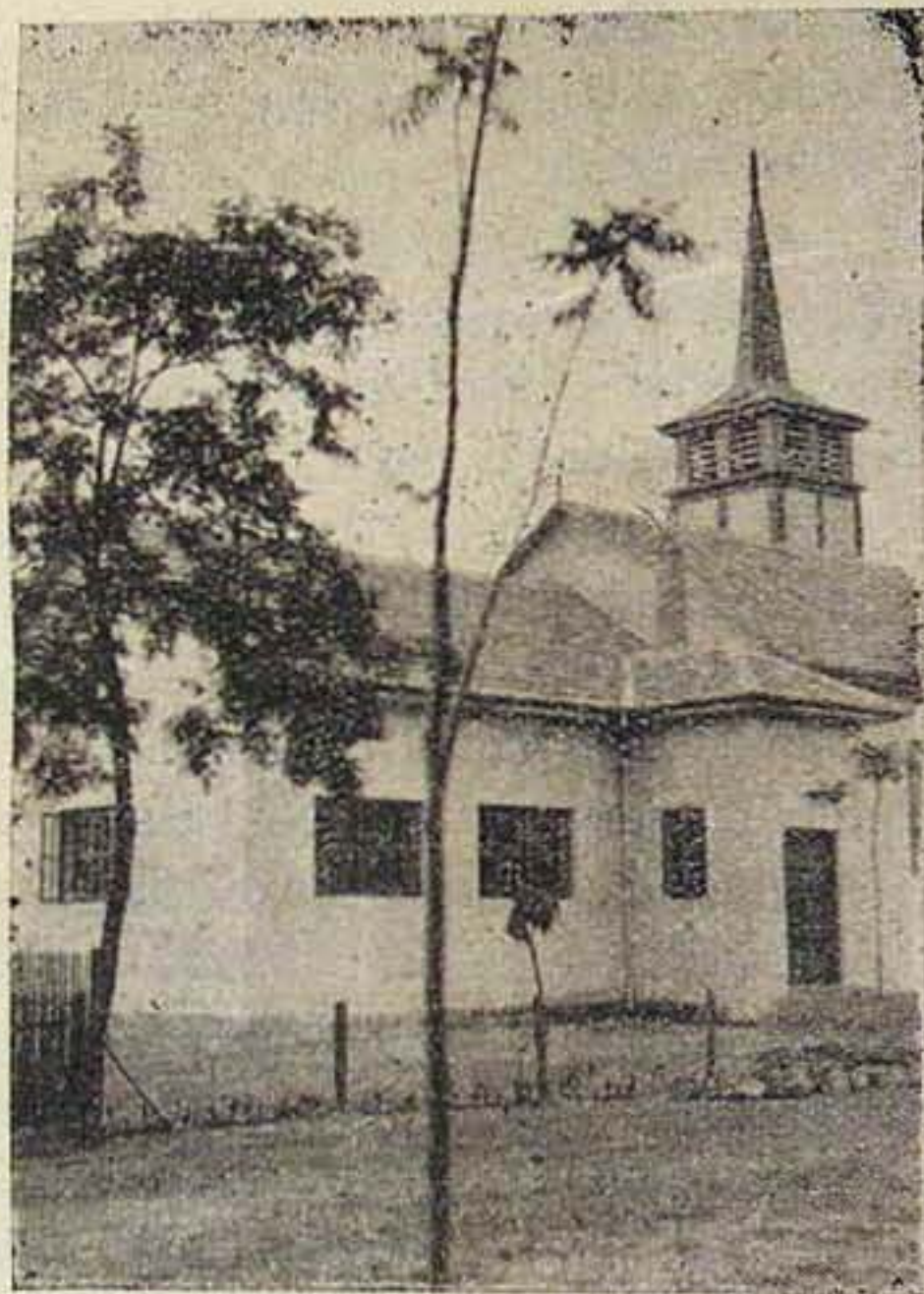
A gyülekezeti ház — Assembly-room

A templom alapkövét 1935. október 3-án reggel áldotta meg Józan Miklós püspöki viká-