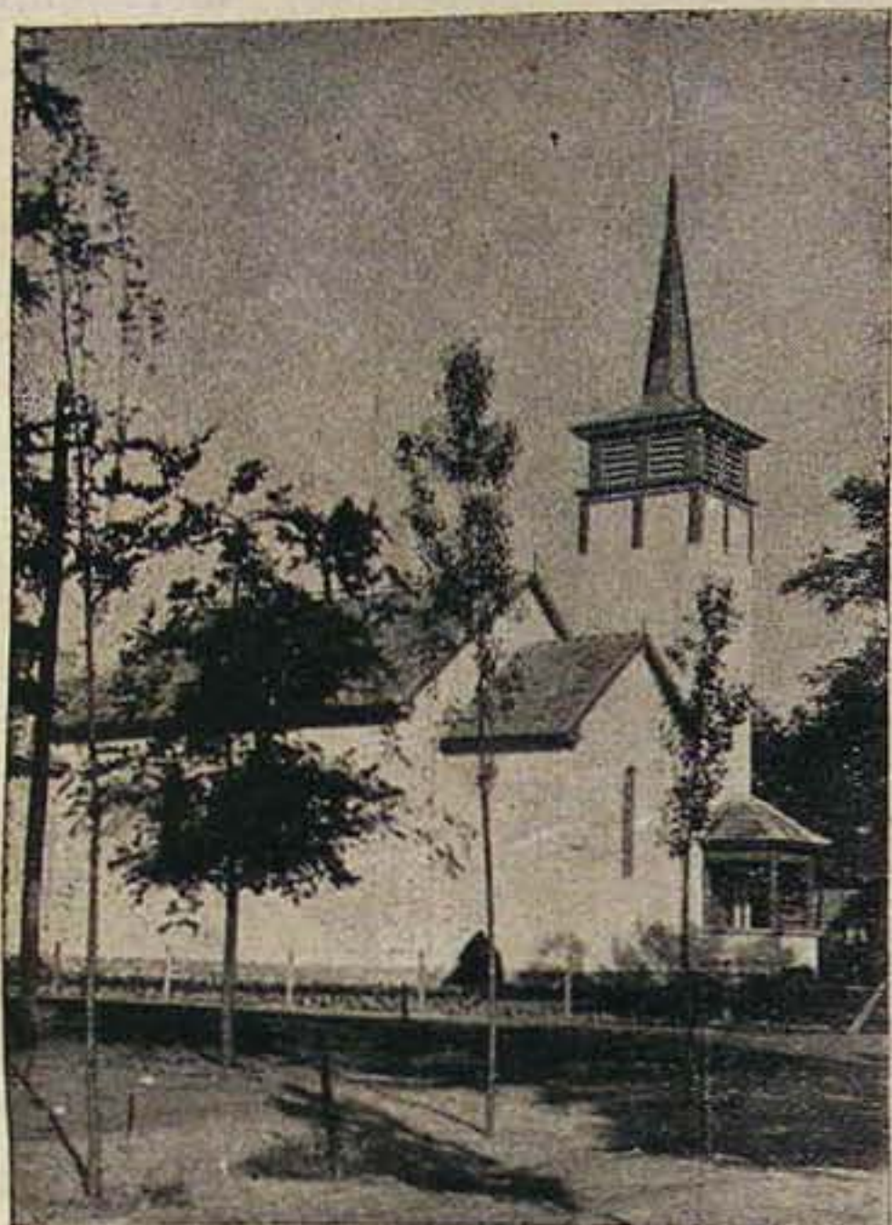
A templom külső képe — The new church at Pestszentlőrinc

Mert a mi vallásunk nemcsak a vasárnapoknak evangéliuma, a mi vallásunk hétköznapi evangélium, a mi vallásunk a munka evangéliuma, a mi vallásunk a szeretet evangéliuma, a mi vallásunk az igazság evangéliuma, a mi vallásunk a megbocsátás evangéliuma, a mi vallásunk maga a Krisztus. Vagy ő, vagy senki! E között kell választanotok és választanunk mindannyiunknak kedves testvéreim! Vagy olyan rég volt az a kétezer esztendő, hogy már talán feledésbe is