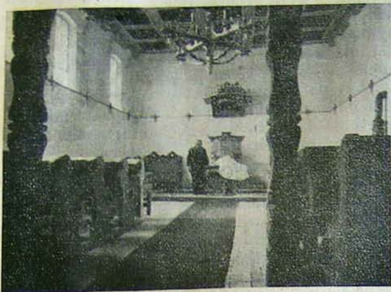
A dunapataji unitárius templom belseje.