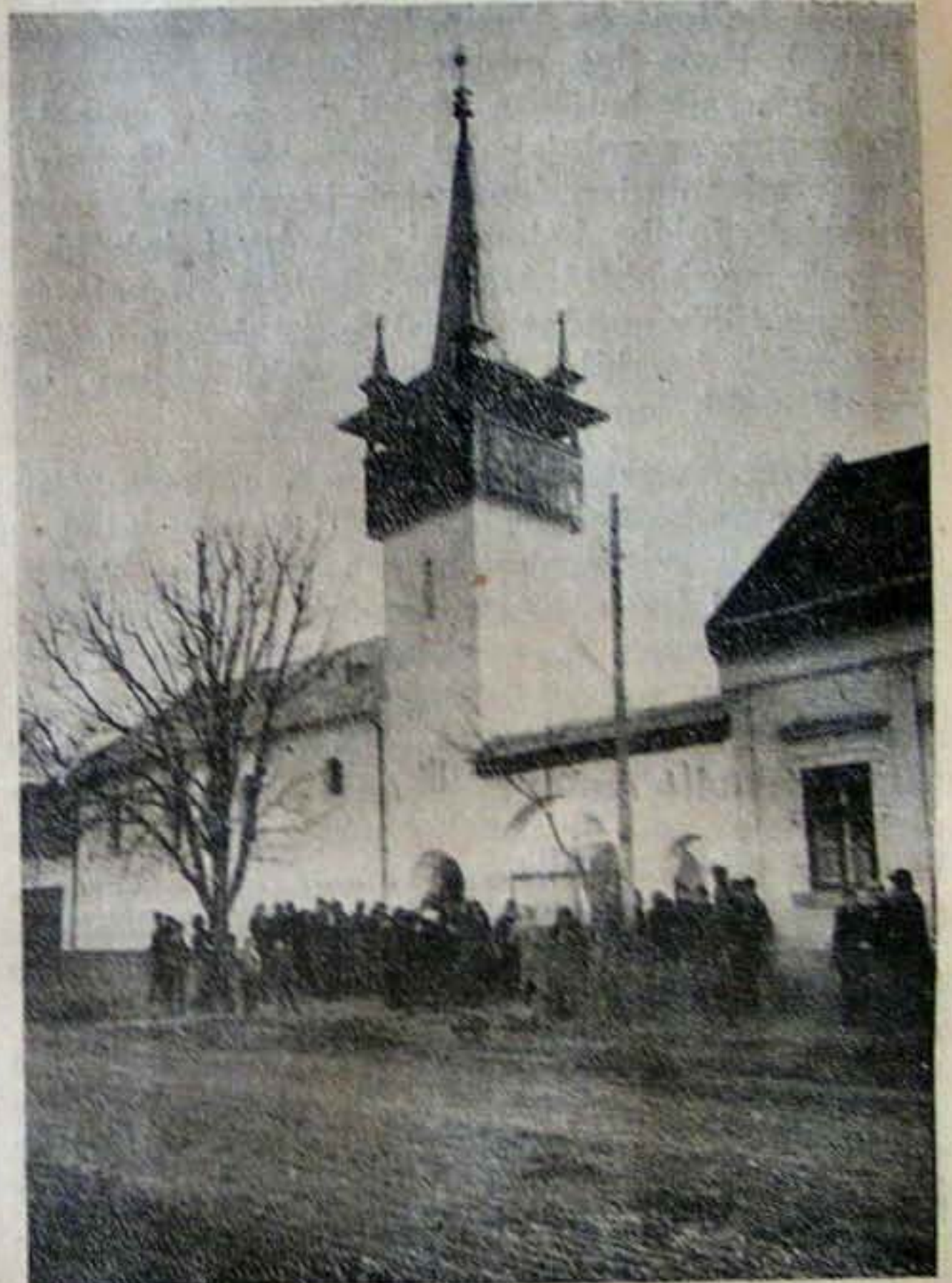
A dunapataji unitárius templom.