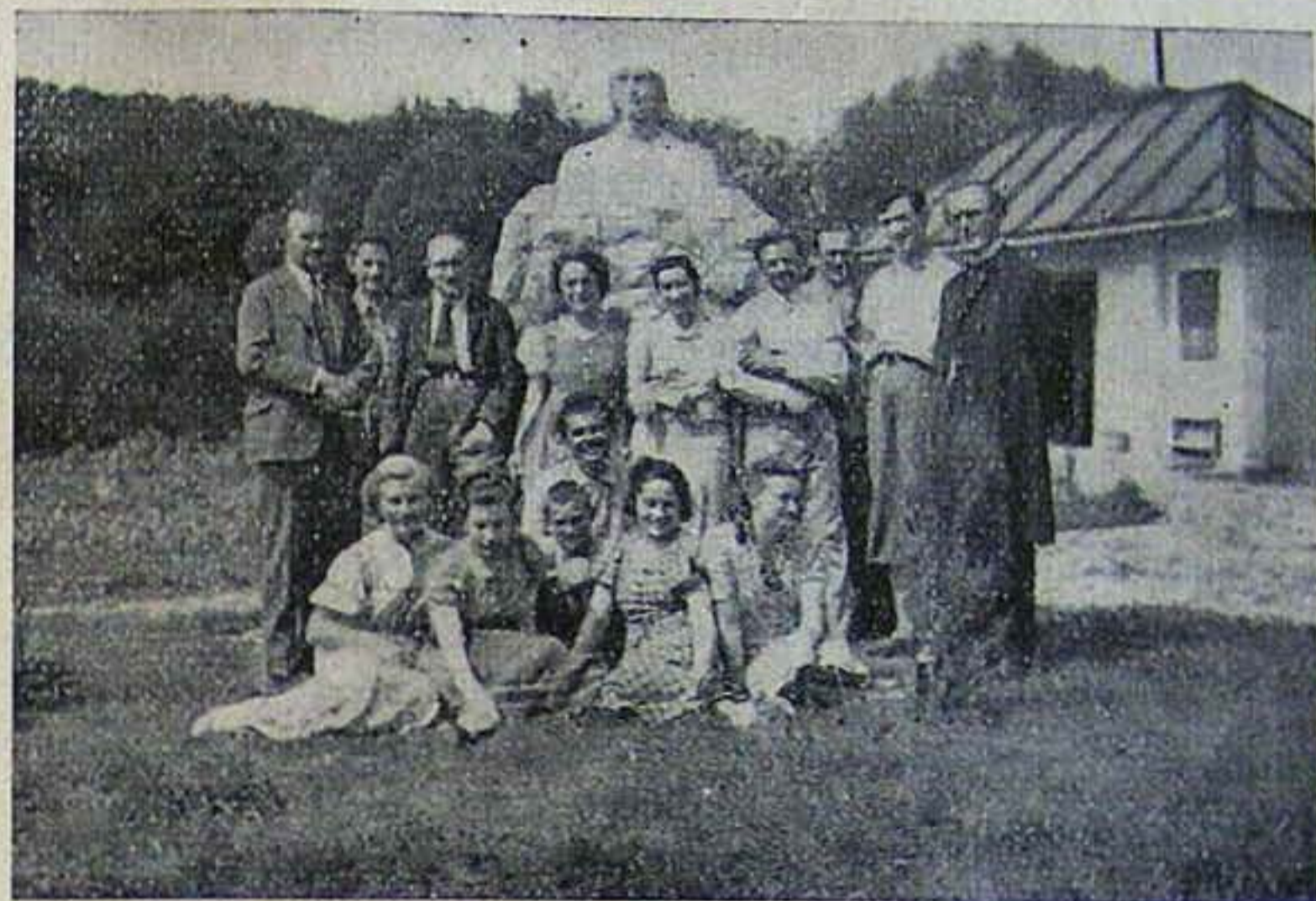
A magyarkúti Ifjúsági Konferencia résztvevőinek egyik csoportja Dávid Ferenc szobra előtt.

Más kérdés az, hogy tulajdonképpen hol beszélünk közvéleményről. Beszélünk nemzeti köz-