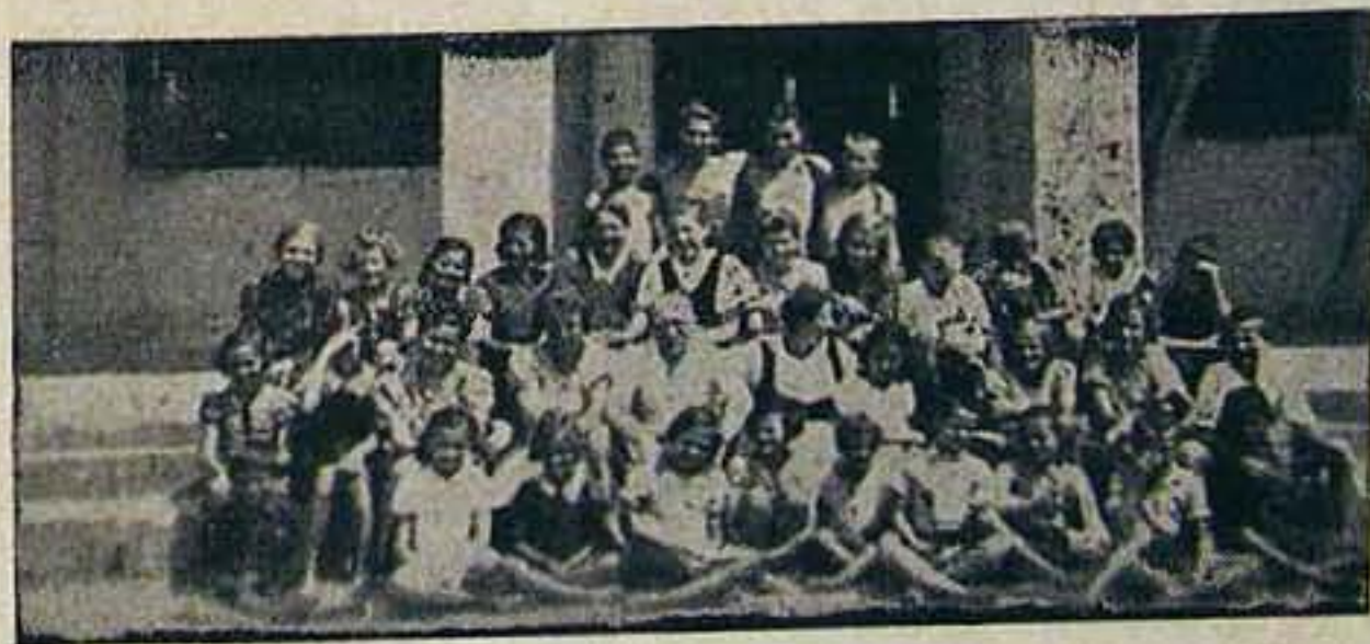
A nyaralók csoportja.