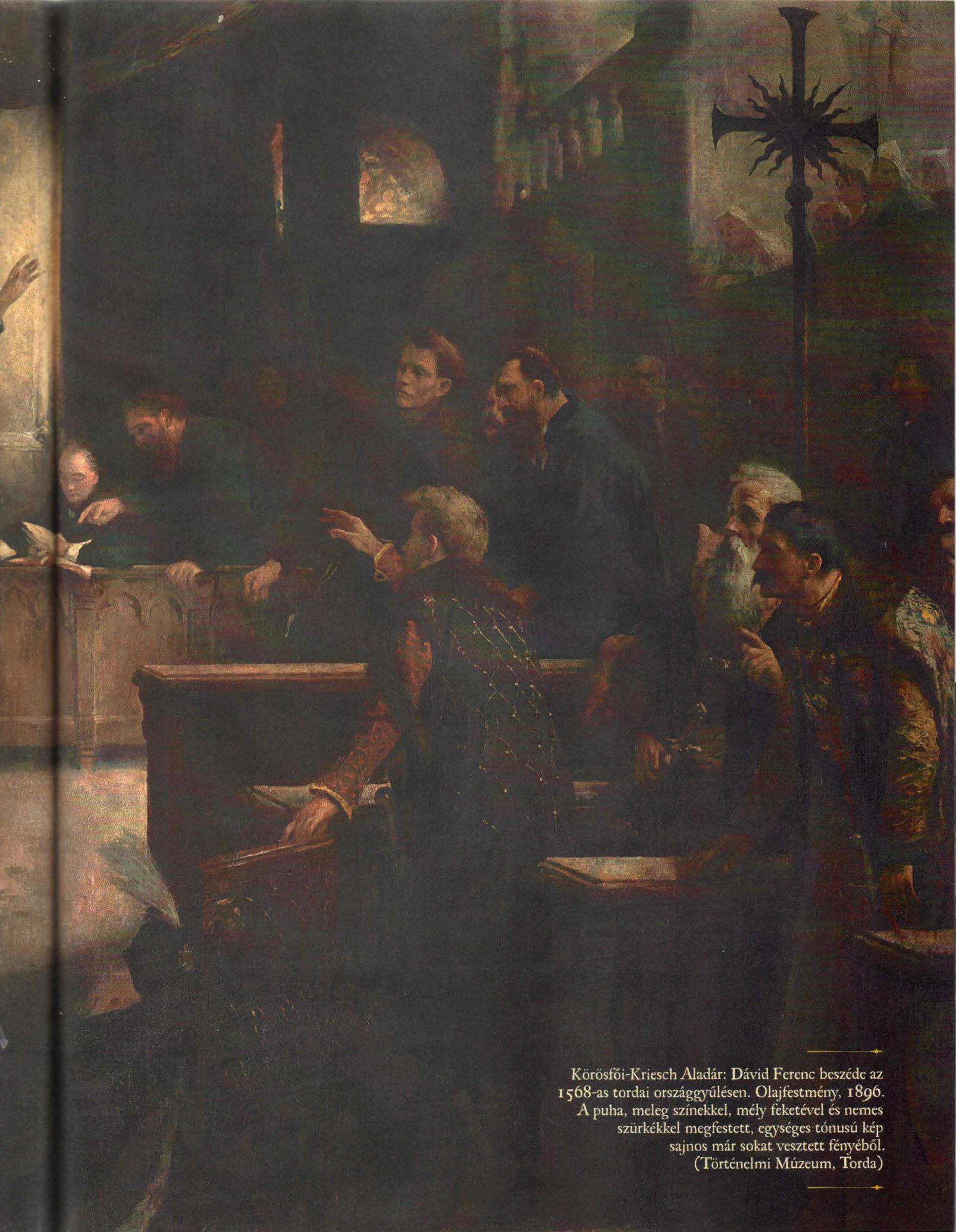
Körösfői-Kriesch Aladár: Dávid Ferenc beszéde az 1568-as tordai országgyűlésen. Olajfestmény, 1896. A puha, meleg színekkel, mély feketével és nemes szürkékkel megfestett, egységes tónusú kép sajnos már sokat veszített fényéből. (Történelmi Múzeum, Torda)