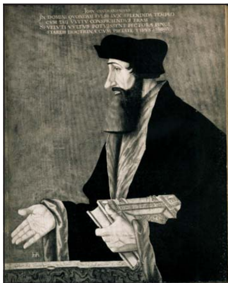
J. Ökolampad (1482–1531) svájci teológus, aki Szervétnek otthont adott Bázelenben