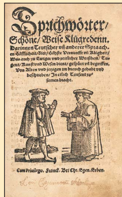
A spiritualista Sebastian Franck művének címlapja, 1555

Teológiájának alapelve a hívő Krisztussal való lelki, misztikus egyesülésének gondolata volt; ennek megfelelően tagadta az úrvacsoratan lutheránus értelmezését, de magát a Bibliát és az egyházi közösséget is pusztán pedagógiai eszköznek tekintette a személyes isten–ember viszony megtalálásában. Minden külsőséget – szertartásokat, szentségeket, az egyházat magát – feleslegesnek tartott ebben a kapcsolatban. A 16. században Kaspar von Schwenkfeld (1489–1561) és Sebastian Franck (1499–1542) voltak az irányzat neves képviselői. F. I.