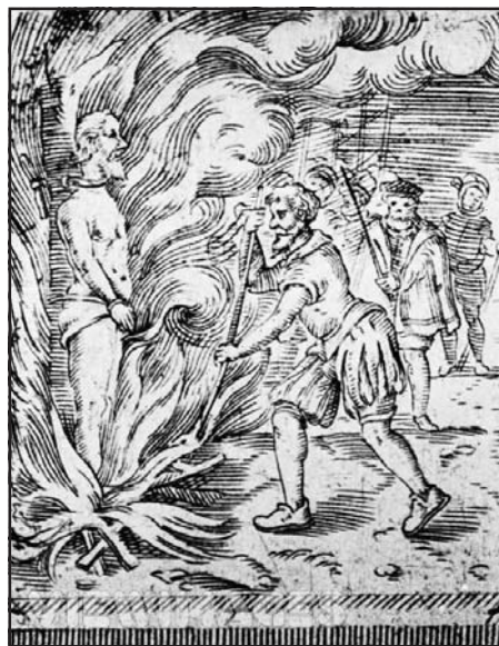
Szervét máglyahalála. Metszet részlete, 17. század

zést. Mint tudjuk, ez nem következett be, Kálvin titkára lett a nyilvános vádló, de hogy Szervétet vezethette ilyen megfontolás, azt nem zárhatjuk ki.