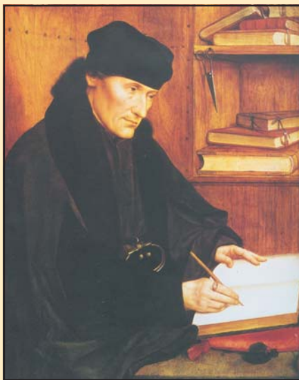
Rotterdami Erasmus. Festménymásolat Quentin Metsys után, 16. század

Humanista műveltségű Ágoston-rendi szerzetes, filozófus, teológus. Főleg Párizsban, Leuvenben, Angliában és Bázelen tevékenkedett. Egyik helyen sem volt „otthon”. Bár egész életében megtartotta római katolikus hitét, műveiben bírálta a skolasztikát, a római egyház mértéktelen hatalmát, intézményrendszerét, és ezzel olyan kérdéseket vetett fel, amelyekkel később a reformáció foglalkozott. Az újítók túlzó eszméitől és gyakorlatától Erasmus azonban ugyanúgy idegenkedett, mint az egyház merevségétől. Alapvetően nem kételkedett a hagyományos hittételek igazságában; az egyházi étellel szembeni bírálata a hittételek megtisztítását és az intézményrendszer reformját célozta. Tudósként igyekezett a tudományos munka módszereit megszabadítani a skolasztika, a