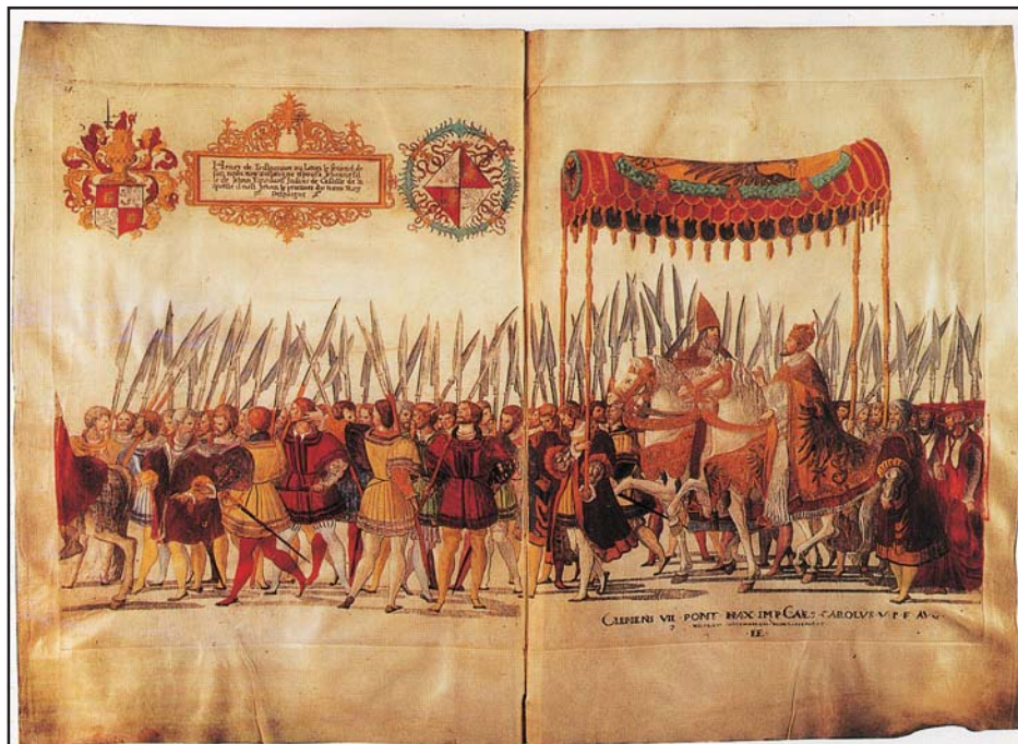
V. Károly és VII. Kelemen pápa Károly német-római császárrá koronázásán. Bologna, 1530. Nicolaus Hogenberg színezett rézkarcsorozatának egyik darabja, 1530–1536