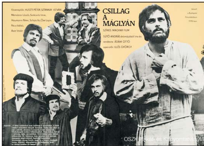
Sütő András Szervét-dramájából készült film plakátja, 1979

kal látta el. A kihallgatás jegyzőkönyve szerint Szervét akkor szünt meg védekezni, amikor vallatói ezzel a példánnyal is szembesítették.