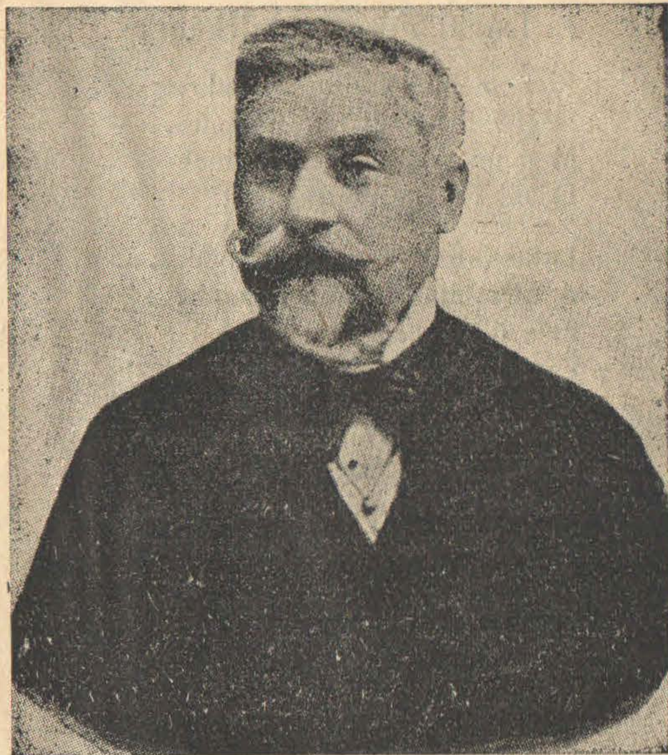
BERDE MÓZES. (1815—1893).

* * * Lelked által Úr-Isten! Épüljön a te néped, Nevedekjék itten Szent gyülekezeted, Szenteltessék nagy neved.