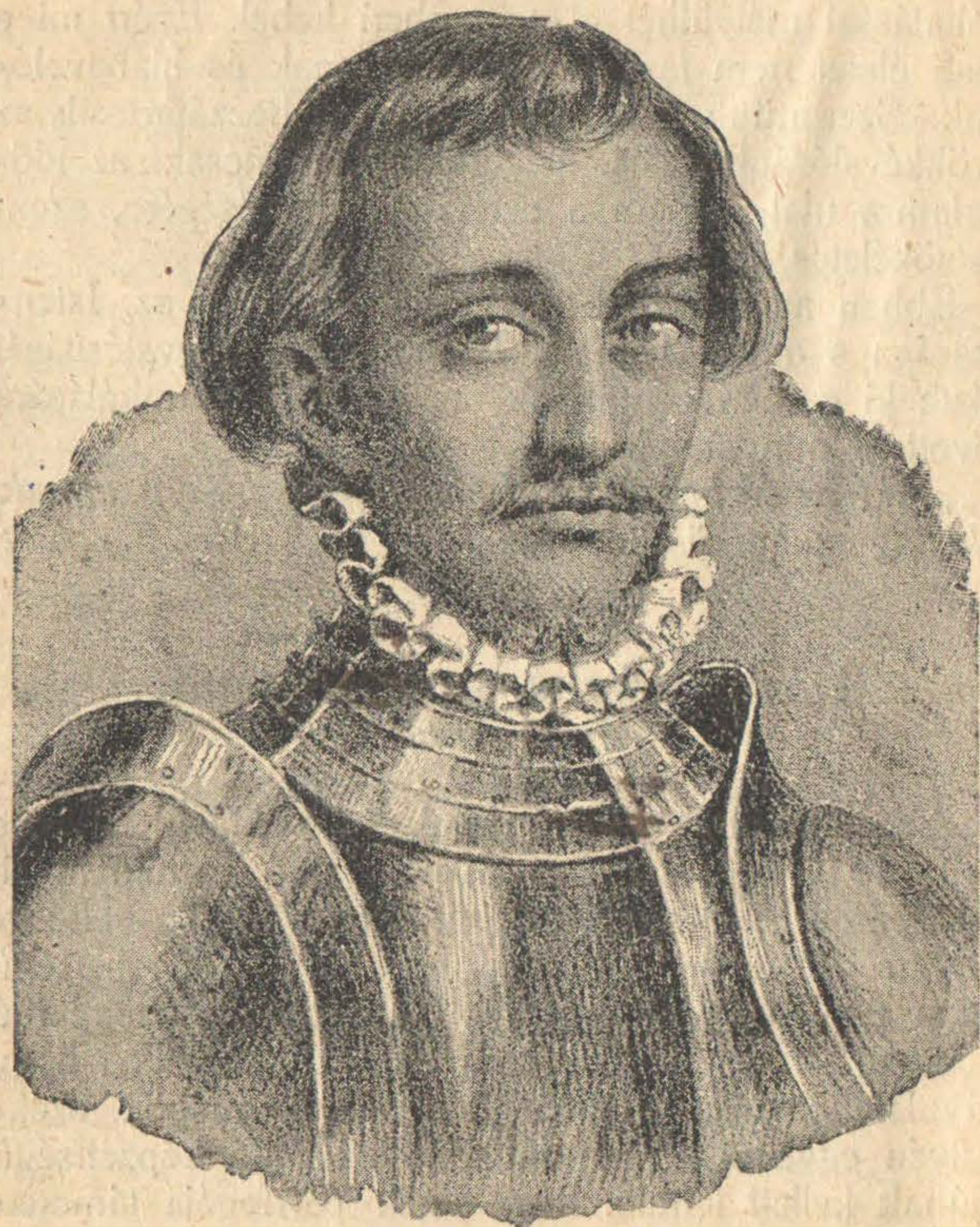
JÁNOS ZSIGMOND, Erdély unitárius fejedelme. (1540—1571),