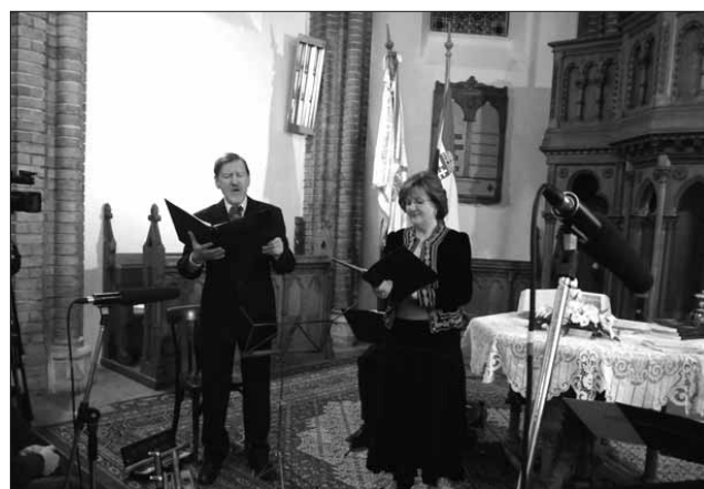
Ars Renata régizene együttes