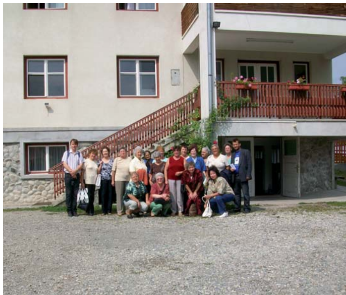
A BUE Nőszövetsége támogatni kívánja a Lókodi Kiss Rozália Ökumenikus Öregotthont