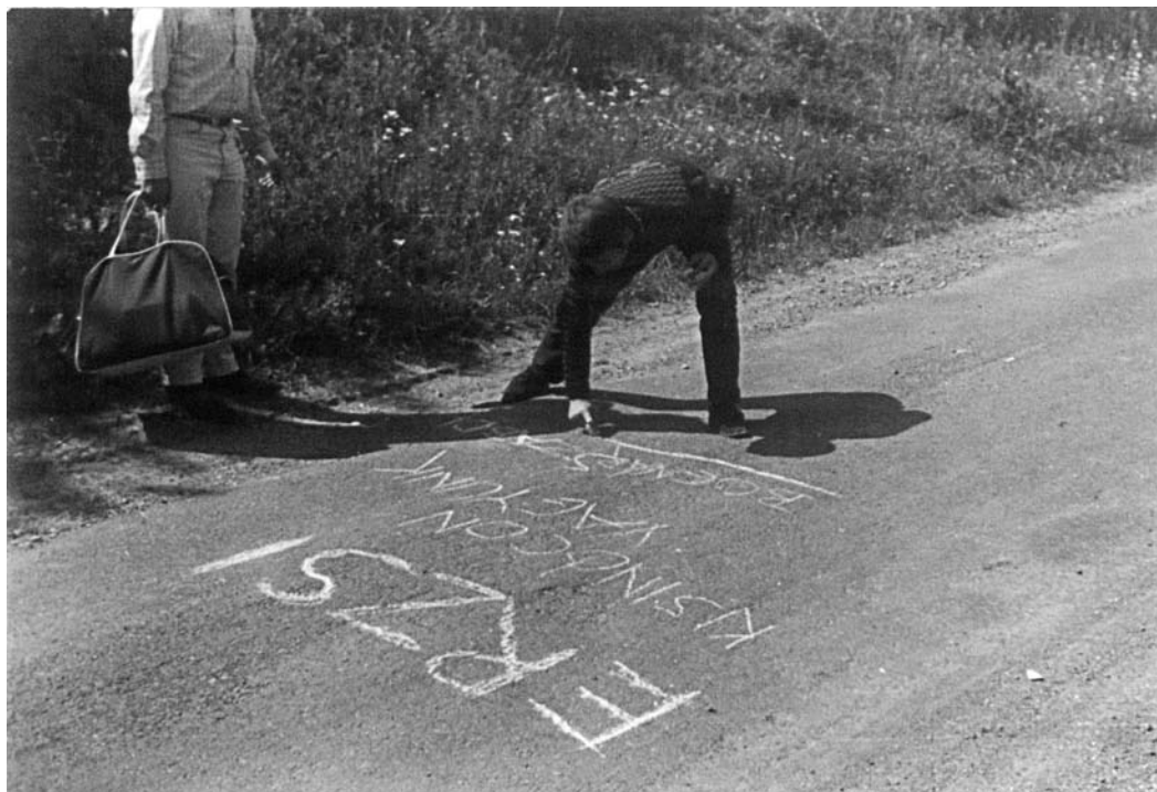
1967-ben mobilüzenet helyett, a vendégház előtti úton