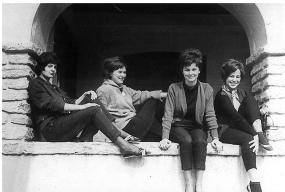
Diákszállás galériája 1963-ban