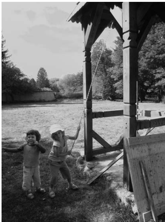
Emlékeztetőül a régi gyerekszállás és vadászház mai képei: