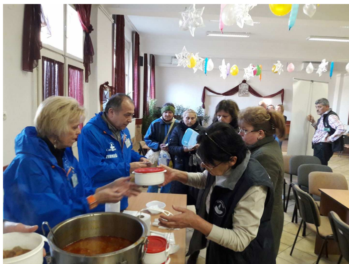
Ételosztás a Civil Házban Pesterzsébeten

A korábbi évekhez hasonlóan 200 adag babgulyást szolgáltunk fel. Az adventi adománygyűjtésből megmaradt tartós élelmiszert is kiosztottuk az alkalmi ebédlőbe betért rászorulóknak.