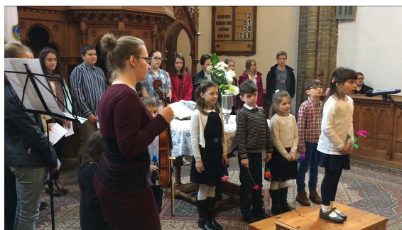
Gyermekek anyáknapra mősora

elhangzottak többek között Vivaldi és Mozart művei is.