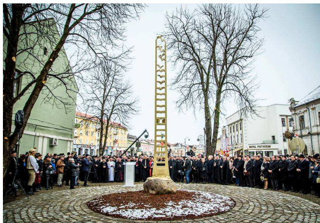
A vallásszabadság Tordán felállított emlékműve