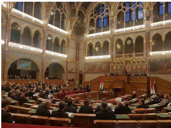
A Vallásszabadság Napját törvénybe iktató parlamenti ülés

melynek keretében az Országgyűlés törvényt hozott arról, hogy január 13-át, a tordai ediktum elfogadásának napját, a Vallásszabadság Napjává nyilvánítja.