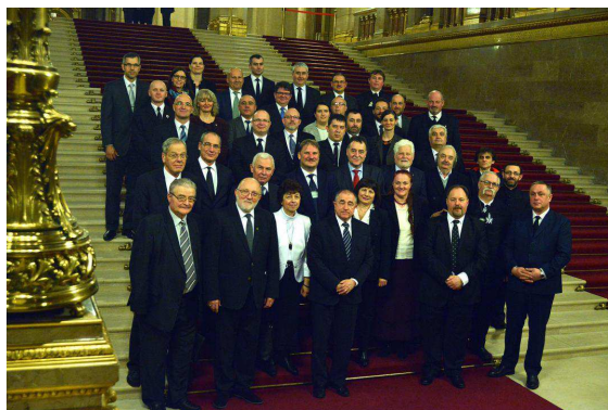
Csoportkép az ünnepi ülésen résztvevő erdélyi és magyarországi unitárius és más felekezeti egyházvezetőkről

Az ünnepi eseményen a mintegy negyven unitárius képviselő mellett, részt vettek az erdélyi magyar és szász történelmi protestáns egyházak képviselői is.”