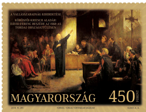
A 450 éves évforduló emlékére megjelent bélyeg

Egyházunk megalapításának 450 éves évfordulója alkalmából alkalmi bélyeget és díszborítékot adott ki a Magyar Posta, melynek ünnepélyes bemutatójára május 13-án , vasárnap Istentiszteletünk alkalmával került sor.