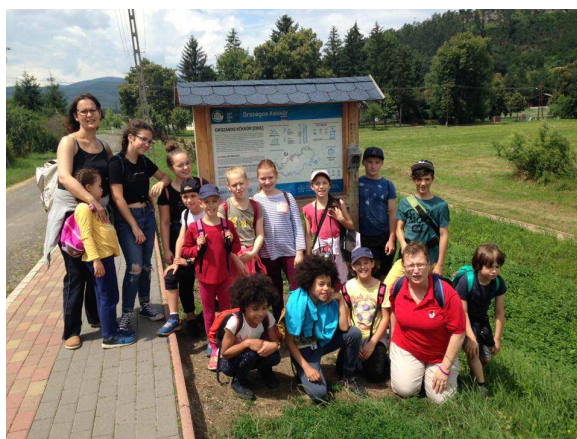
Táborozók csoportja a nógrádi kiránduláson

Programjaink a teljesség igénye nélkül: magokat ültettünk, üveget festettünk, dekopázoltunk, autógumit festettünk, virágot ültettünk, meglátogattuk a nógrádi várat, Szendehelyre kirándultunk, táborújságot raktunk, számháborúztunk.