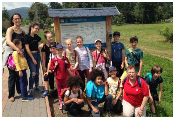
Csoportkép a tavalyi tábor résztvevőiről

A tábor költsége a résztvevők számának, illetve a pályázati források megszerzésének függvényében alakul – ezt legkésőbb május elején tesszük közzé.