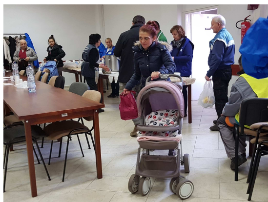
Ételosztás a Civil Házban Pesterzsébeten

Talán örömmre adhat okot, hogy idén látványosan kevesebben éltek az ingyenes ebéd lehetőségével, pedig a helyszín és az időpont is az előző évekből megszokott volt. Reméljük, ez a szegények számának csökkenésével függ össze, és nem valami olyasmivel, amire nem gondoltunk! A megmaradt ételt a közeli Anyaoltalmazó Otthonba szállítottuk.