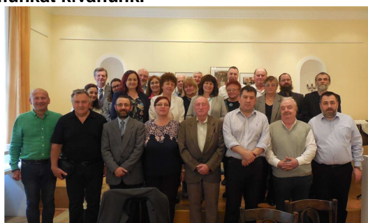
Az egyházkerületi közgyűlés tagjai

A tisztségviselők megválasztásához sok szeretettel gratulálunk és eredményes munkát kívánunk.