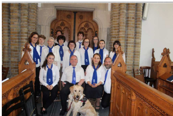
A Budapesti Unitárius Kamarakórus