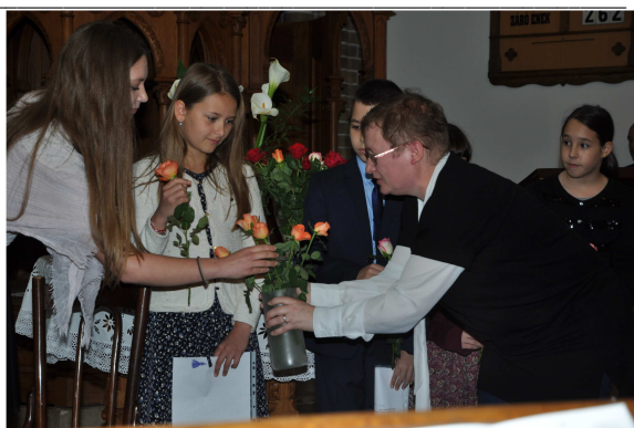
Az anyák napi műsort követően a gyermekek virággal köszöntötték édesanyjunkt

Május 5-én , vasárnap istentiszteletünkön köszöntöttük az édesanyákat . Vasárnapi iskolás gyermekeink rövid műsorral készültek. Istentiszteletünk után szeretetvendégségre, kávézásra került sor, melyet – hagyományteremtő szándékkal – ezután következő vasárnapjainkon is megrendezünk.