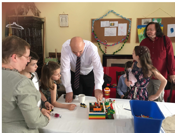
Hittanóra az ifjúsági kuckóban

Amikor egy vegyes házasságban élő édesanya közölte, hogy három gyermekét szeretné megkereszteltetni, akik eddig egyik felekezeti iskolában jártak, most pedig egy másikba fognak beiratkozni. De szeretné, hogy mindezt unitáriusként tegyék. Néha az egyszerű emberek elkötelezettsége megpirongatja a Ielkészt.