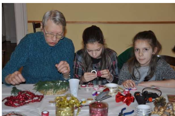
Készül az adventi koszorú

December 2-án az egyházközségünk híveiből alakult Budapesti Unitárius Kamarakórus a Bartók Béla Egyházközség adventi istentiszteletén szolgált.