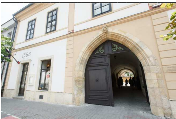
A kolozsvári Vallásszabadság Háza

Az avatóünnepség a kolozsvár-belvárosi unitárius templomban kezdődött délelőtt 11 órától Bálint Benczédi Ferenc püspök ünnepi istentiszteletével. Az istentisztelet során a püspök rámutatott arra, hogy Kolozsvár szívében egy olyan ház felújítását sikerült elvégezni, amelyre az elmúlt évtizedek alatt kétszer is kimondták a halálos ítéletet. Bálint Benczédi Ferenc záró gondolataiban megosztotta azon reményét, hogy „az épület a vallásszabadságnak nem csak háza, hanem otthona lesz”.