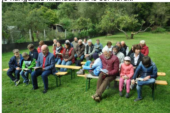
A magyarkúti szabadtéri istentisztelet hallgatósága

2018. szeptember 29-én, szombaton nyárbúcsúztató gyülekezeti találkozóra került sor Magyarkúton, egyházi ingatlanunkban, a Fenyőliget Vendégházban. Már a reggeli óráktól vártuk vendégeinket: híveink együtt főztek, majd a szokásoknak megfelelően 12 órától istentisztelet tartottunk. Az ebéd elfogyasztása után egy jó hangulatú kirándulásra is sor került.