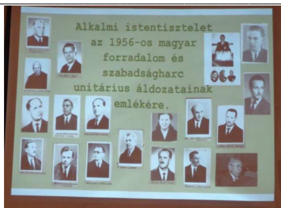
1956 erdélyi unitárius áldozatai

Az előadásokat vetített képernyőn követte a Vallásszabadság Házáról, amely részletesen bemutatta a beruházást, a kivitelezés folyamatát, nehézségeit és szépségeit. A délutáni program tartalmazta a Vallásszabadság Házának, valamint Kolozsvár nevezetességeinek megtekintését, illetve – alternatív lehetőségként – a Házsongárdi temetőbe történő látogatást és koszorúzást. Végül, de nem utolsó sorban alkalmam nyílt megismerkedni az erdélyi egyházak gondnokaival is, akikkel mindkét napon jó hangulatú beszélgetést, tartalmas eszmecsere-t folytattunk.