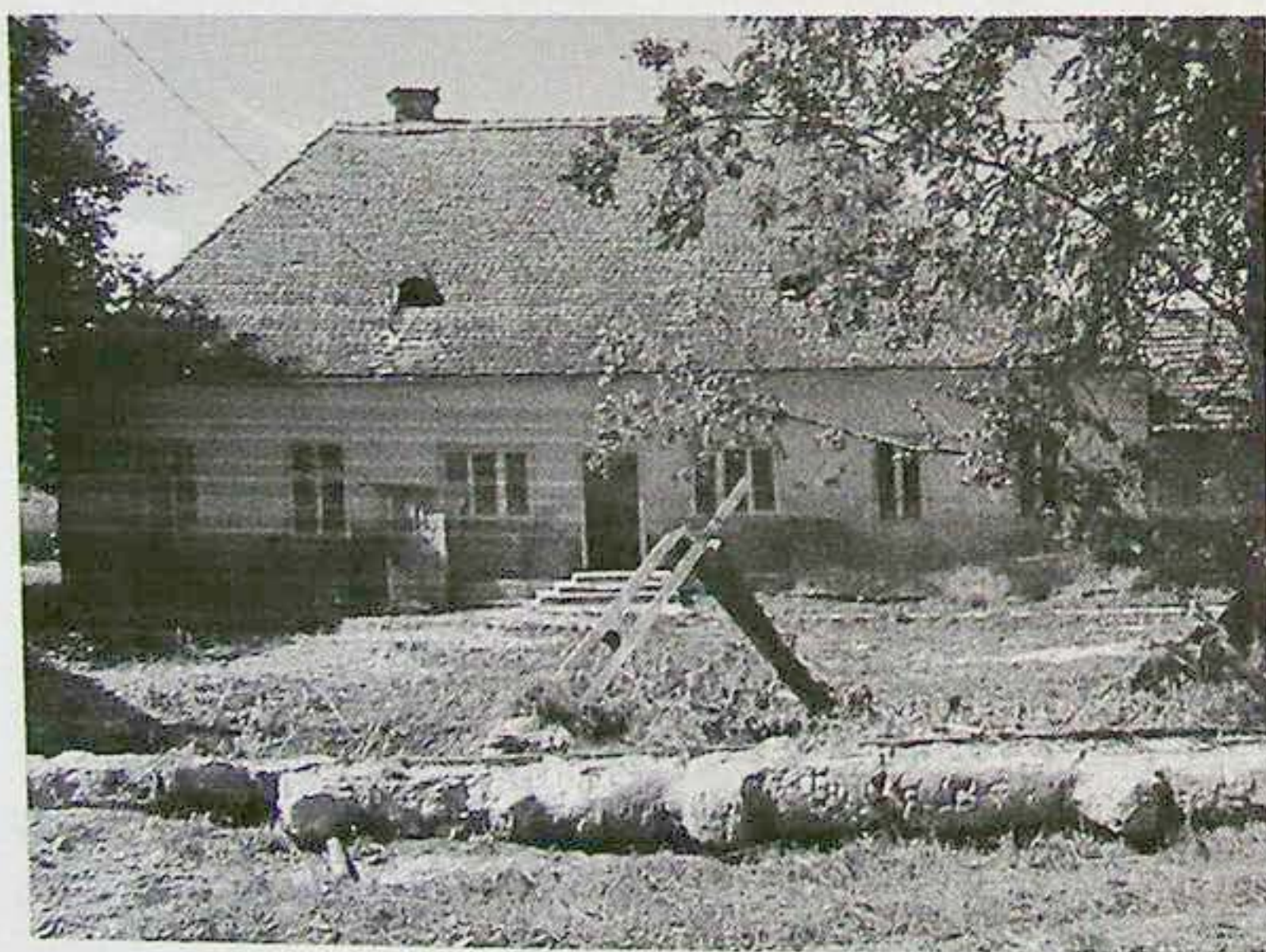
A kobátfalvi óvoda megsérült épülete

Amint arról a magyarországi média is részletesen beszámolt, 2005. augusztus 23-án a nagy esőzések miatt megáradt folyók, patakok rombolása emberi áldo-