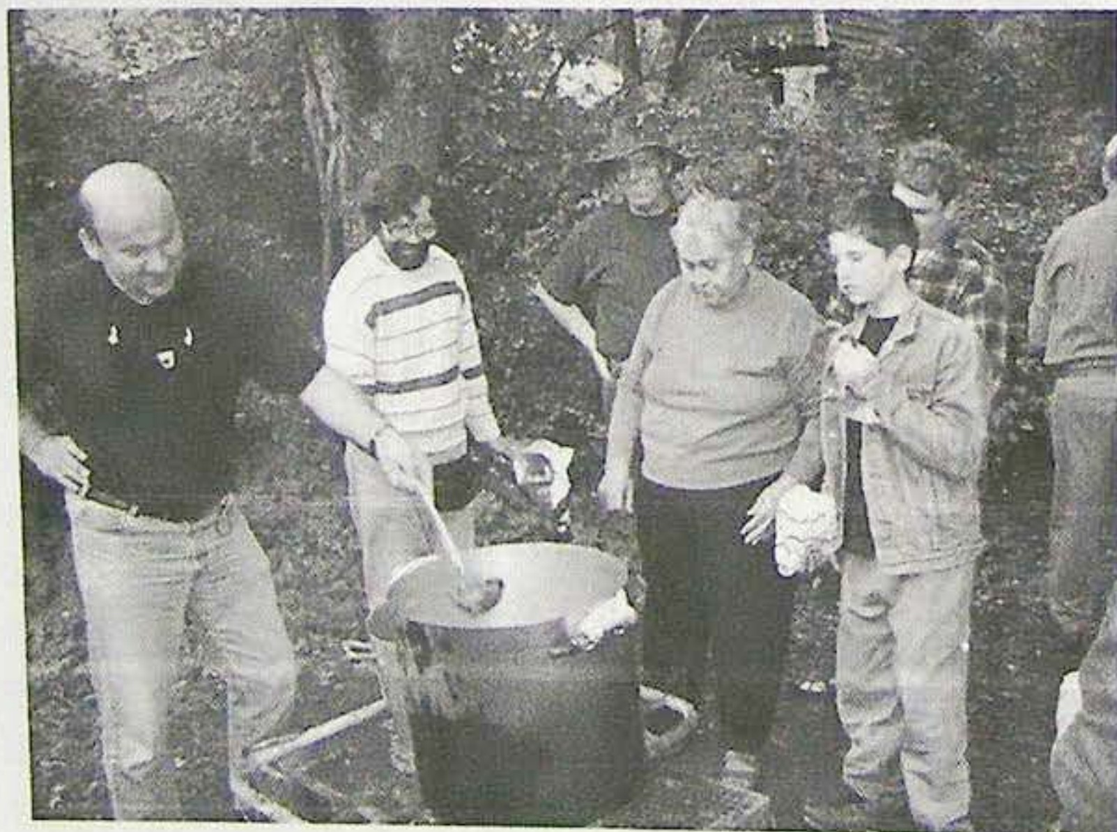
Készül a gulyásleves a magyarkúti esőben

A 2005. évi őszi magyarkúti találkozóra szeptember