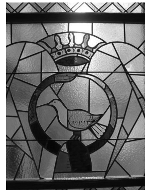
A felújított címeres ablak a lépcsőfordulóban