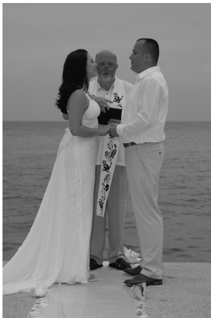
Esketés a tengerparton

Két rendhagyó esketési szertartásra került sor az utóbbi időben. Azért írom, hogy rendhagyó volt mindkettő, hiszen ezeknek körülményei is azok voltak. Az egyik, mivel azt a Yucatan félszigethez tartozó Cosumel szigetén végeztem, azon a gyönyörű szép Karib tengerhez tartozó világban, amelyet J. Cousteau fedezett fel a könnyű bűvárok szerelmeseinek pár évtizeddel ezelőtt. Egyesült Államokban élő keresztfiamat és menyasszonyát kísérte el ide, erre a számukra nagyon kedves helyre, a rokonok és barátok, mintegy negyven tagú vendégserege. Itt pontosan