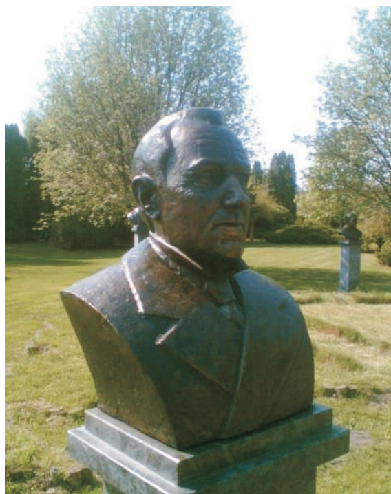
Józán Miklós, az unitáriusok egyesítő püspökének mellszobra Lakiteleken

Az Erdélyi Csillagok névre keresztelt rendezvénysorozat 10 órakor kezdődött a Népfőiskola Kölcsey Házának nagy előadótermében. Páll Lajos festőművész kiállításának megnyitása után a házigazda Lezsák Sándor köszöntötte a mintegy 100, főként unitárius vendéget. Emlékeztetett, hogy ez már a harmadik alkalom, amikor az unitáriusokkal találkozik Lakiteleken. Először 1999-ben rendezett a Népfőiskola unitárius emléknapot, majd 2001-ben a másodikat, amelynek keretében Józán Miklós unitárius püspök mellszobrának felavatására került sor, a magyar püspökök emlékparkjában.