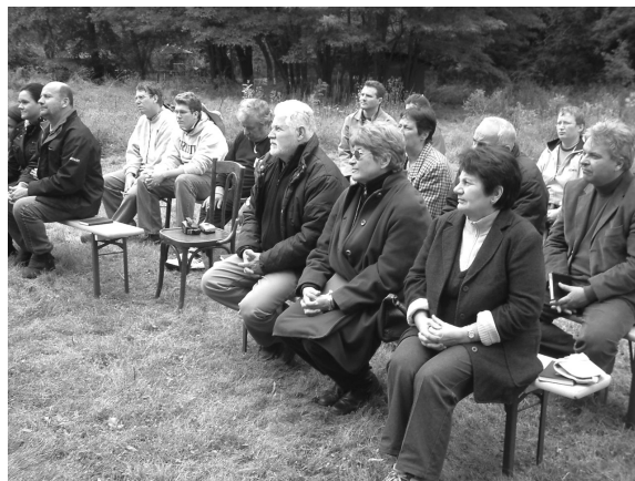
Az istentisztelet hallgatósága