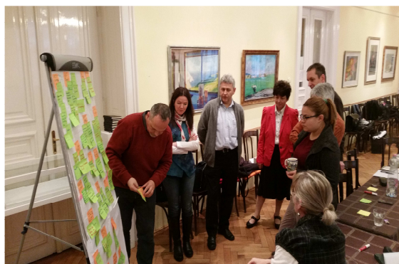
Munkában a Presbitérium – ilyen sok javaslatunk volt

A Presbitérium, annak érdekében, hogy pozitív változásokat indítson el az egyházközség életében, 2017. november 12-én, szombaton, egész napos műhelymunka ülést tartott a Nagy Ignác utcai gyülekezeti teremben, melyen a Presbitérium tagjain kívül a gyülekezet vezető lelkésze, segédlelkésze és kántora is részt vett.